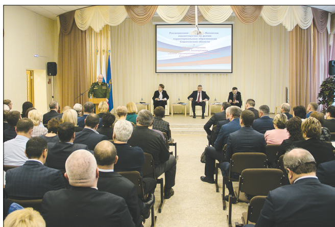
Участники расширенного заседания.

«Проведение мероприятия такого уровня в Татищевском районе — это, безусловно, показатель большой работы руководства района по созданию условий для развития территории и для жизни его людей. Я вижу,