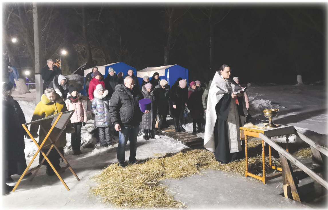
В Крещенский сочельник на р.Идолга пришло немало татищевцев.