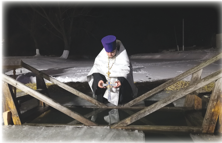
По окончании Богослужения был совершен чин Великого освящения воды в купели.