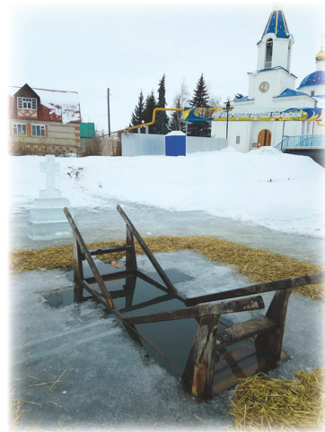
Купель на реке Идолга в р.п. Татищево