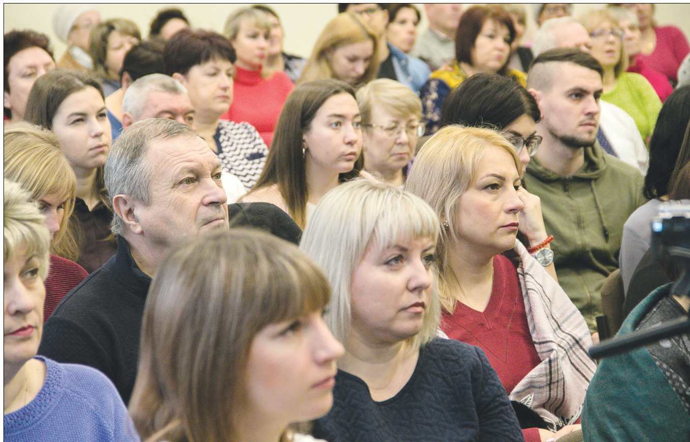
Проект нашел положительный отклик и активную поддержку среди жителей Татищево.