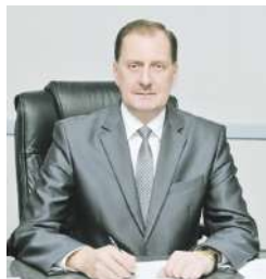
Уважаемые жители Татищевского района! Поздравляю вас с Днем народного единства!

Во все времена россияне с отвагой и мужеством защищали Родину, принося ей славу непобедимой и великой Державы, а единство и патриотизм всегда были для нас самой надёжной опорой. Мы — единый народ с богатой историей и культурными традициями. Сегодня от нашей гражданской солидарности зависит будущее страны и народа. Только вместе, объединив усилия, мы сможем преодолеть любые трудности, изменить жизнь к лучшему. От всей души желаю вам здоровья, счастья, всеобщего согласия и благополучия! С праздником!