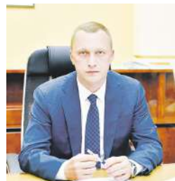
Уважаемые жители Саратовской области!

День народного единства посвящен людям, искренне любящим свою страну, которые во все времена плечом к плечу вставали на защиту Родины. Этот день посвящен истории нашего великого государства, сила которого в народной сплоченности. События давних лет служат нам примером верности Отечеству, единения, настоящего гражданского подвига. Так было века назад и в годы Отечественной войны, и будет всегда. Только сообща можно все преодолеть, вместе сражаться и трудиться ради счастья детей, ради будущего России. С праздником вас! Всего самого доброго!