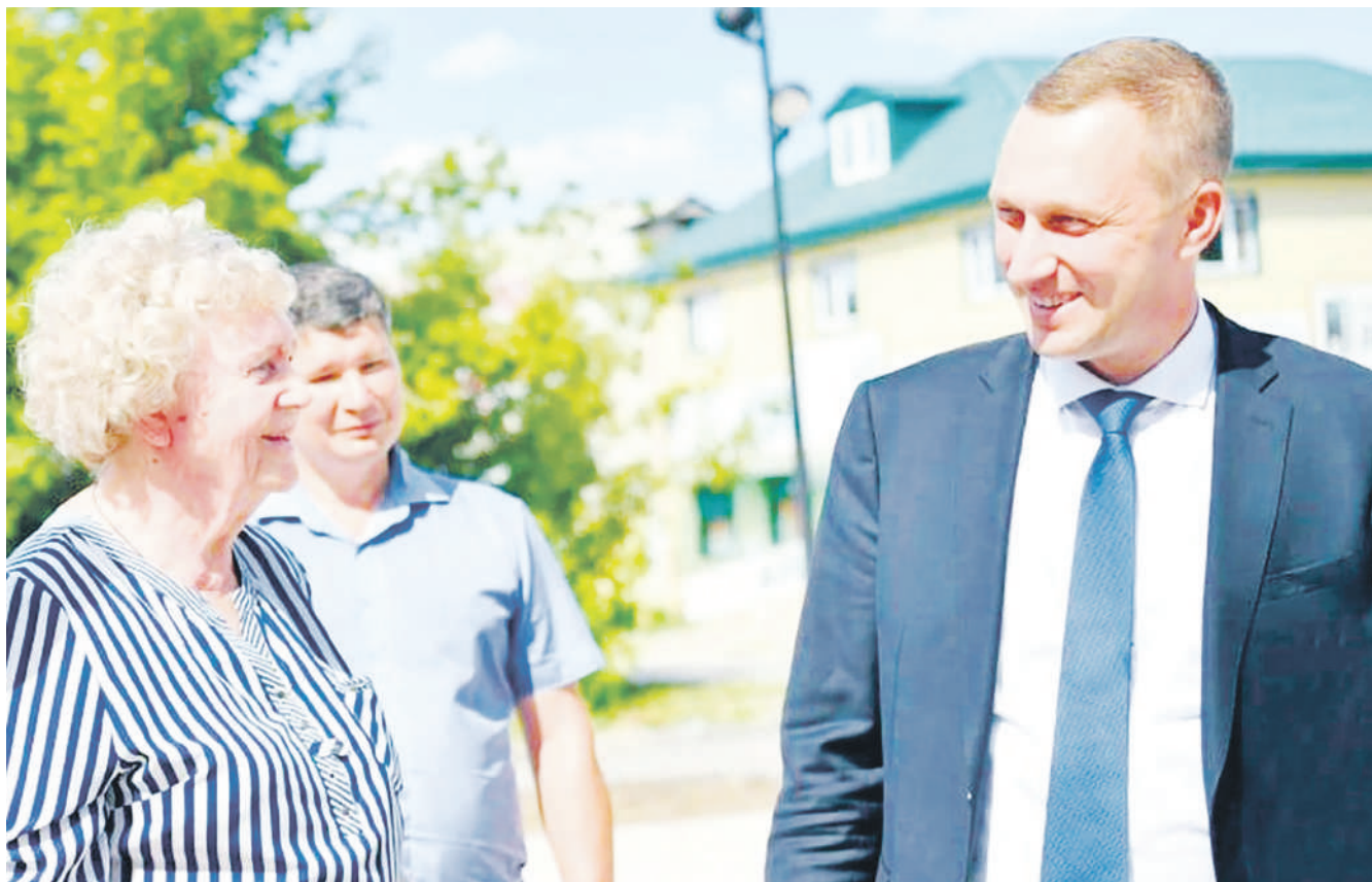
В районах Заволжья начался ремонт тротуаров. В рамках рабочей поездки врио Губернатора Роман Бусаргин посетил три района - Озинский, Дергачевский, Ершовский.