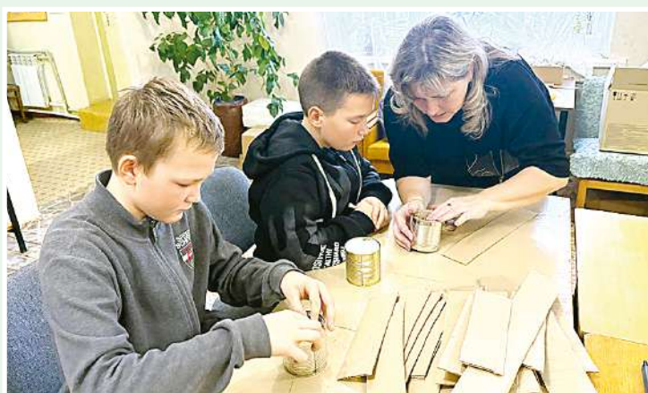
Мастер-класс по изготовлению «армейского сухого душа» и окопных свечей в Центральной библиотеке р.п. Татищево.

Татищевский район продолжает поддерживать наших бойцов, находящихся в зоне проведения специальной военной операции. Жители изготавливают окопные свечи, сухой душ, подушки, вяжут тёплые вещи и маскировочные сети, собирают продукты и медикаменты. Они уверены, что только объединив усилия, можно приблизить победу и обеспечить мирное будущее для страны.