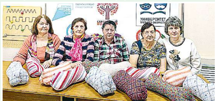
Ветераны Центра социального обслуживания населения Татищевского района сделали удобные подушки в форме косточек, чтобы обеспечить комфорт военнослужащим, проходящим лечение в госпиталях.

Татищевский район продолжает поддерживать наших бойцов, находящихся в зоне проведения специальной военной операции. Жители изготавливают окопные свечи, сухой душ, подушки, вяжут тёплые вещи и маскировочные сети, собирают продукты и медикаменты. Они уверены, что только объединив усилия, можно приблизить победу и обеспечить мирное будущее для страны.