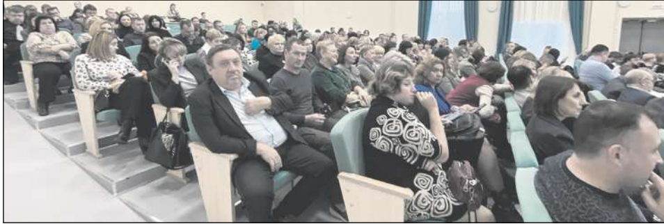
В обсуждении проектов участвуют представители общественности

Председатель Государственной думы Вячеслав Володин призвал оппонентов слышать друг друга, вести диалог, приходиться к компромиссу и не превращать обсуждение в противостояние, чтобы важные для Саратова проекты реализовывались, а не замораживались на долгие годы.