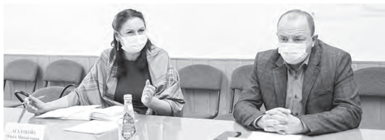
В ходе заседания оперативного штаба.

По словам заместителя главного врача по клинико-экспертной работе Татищевс-