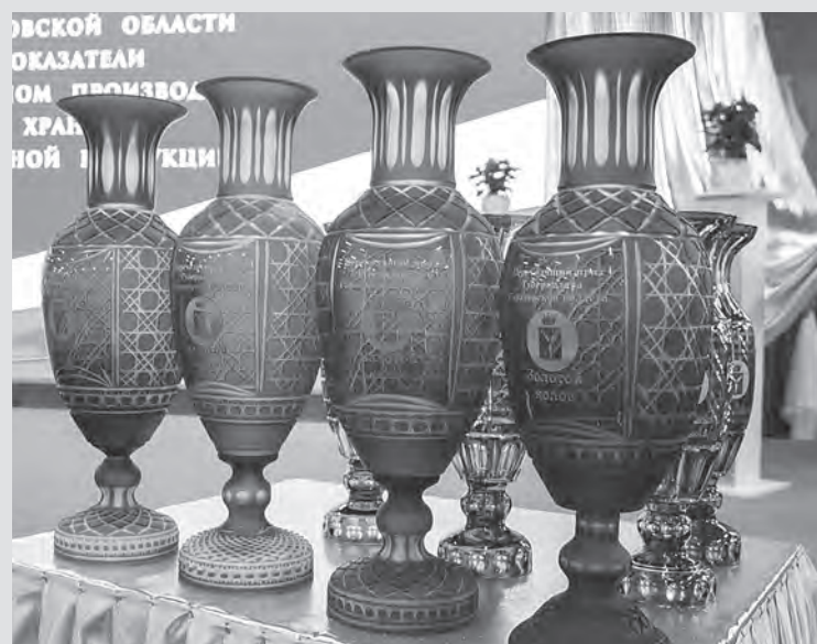
Ценная награда — за высокие показатели в сфере сельского хозяйства.