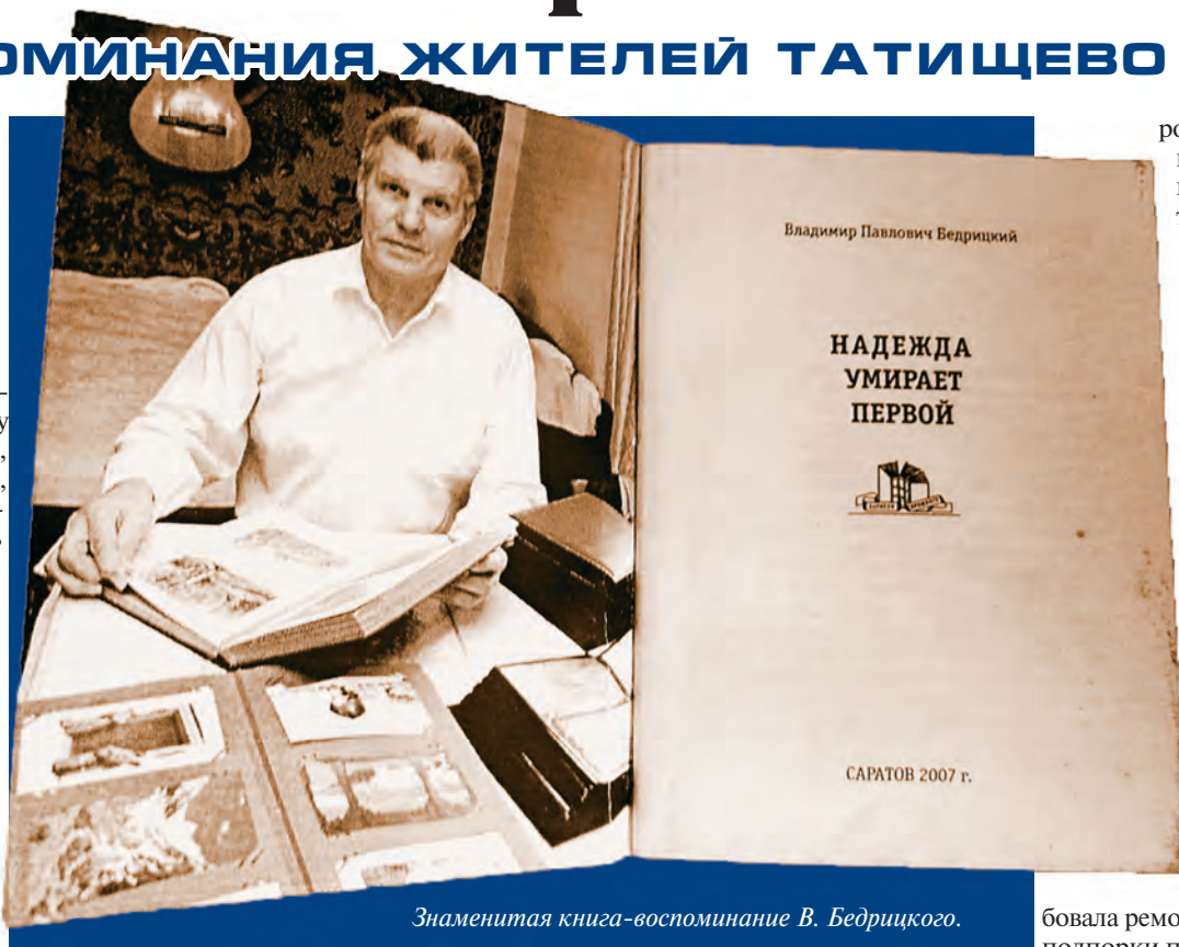
Знаменитая книга-воспоминание В. Бедрицкого.

Отец писал матери письма. В воинских треуголках был призыв беречь себя и детей. Мама бережно хранила их в сумке вместе с белыми вязаными беретами и памятными вещами. Письмо, в котором