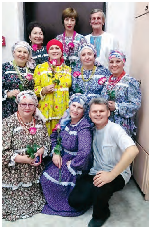
«Театр» народной песни — ансамбль «Россиянка».