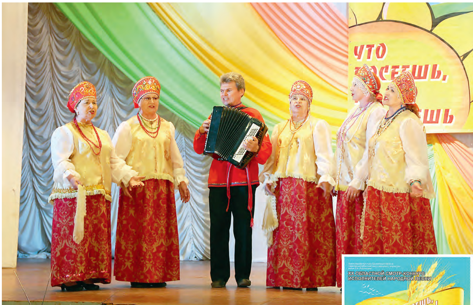
Каждое выступление «Россиянки» — настоящий праздник для сельчан.

- Я люблю свой коллектив и ценю каждого человека. Если заболит один - коллектив и «звучит» уже по-другому. Моя бабушка говорила: «Один пальчик поранить - всей руке больно». Поэтому дорожим каждым участником. С самого начала у нас сложились уважительные и доверительные отношения. И я намеренно не выделяю кого-то одного, потому что этим можно обидеть остальных - руководителю приходится быть еще и психологом. Наш коллектив - это одна большая семья, где каждый старается ответственно относиться к концертам и репетиционному процессу. Мы прос-