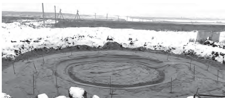
Подготовка площадки под новый резервуар.

На сегодняшний день работы продолжают. И совсем скоро будут запущены две скважины и резервуар возле пруда Михайловский для обеспечения качественной подачи воды татищевцам, проживающим по левую сторону железной