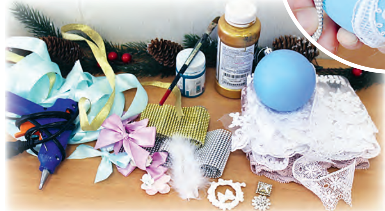
Набор материалов для сегодняшнего мастер-класса.

Эксклюзивные новогодние шары станут главным украшением вашей ёлки.