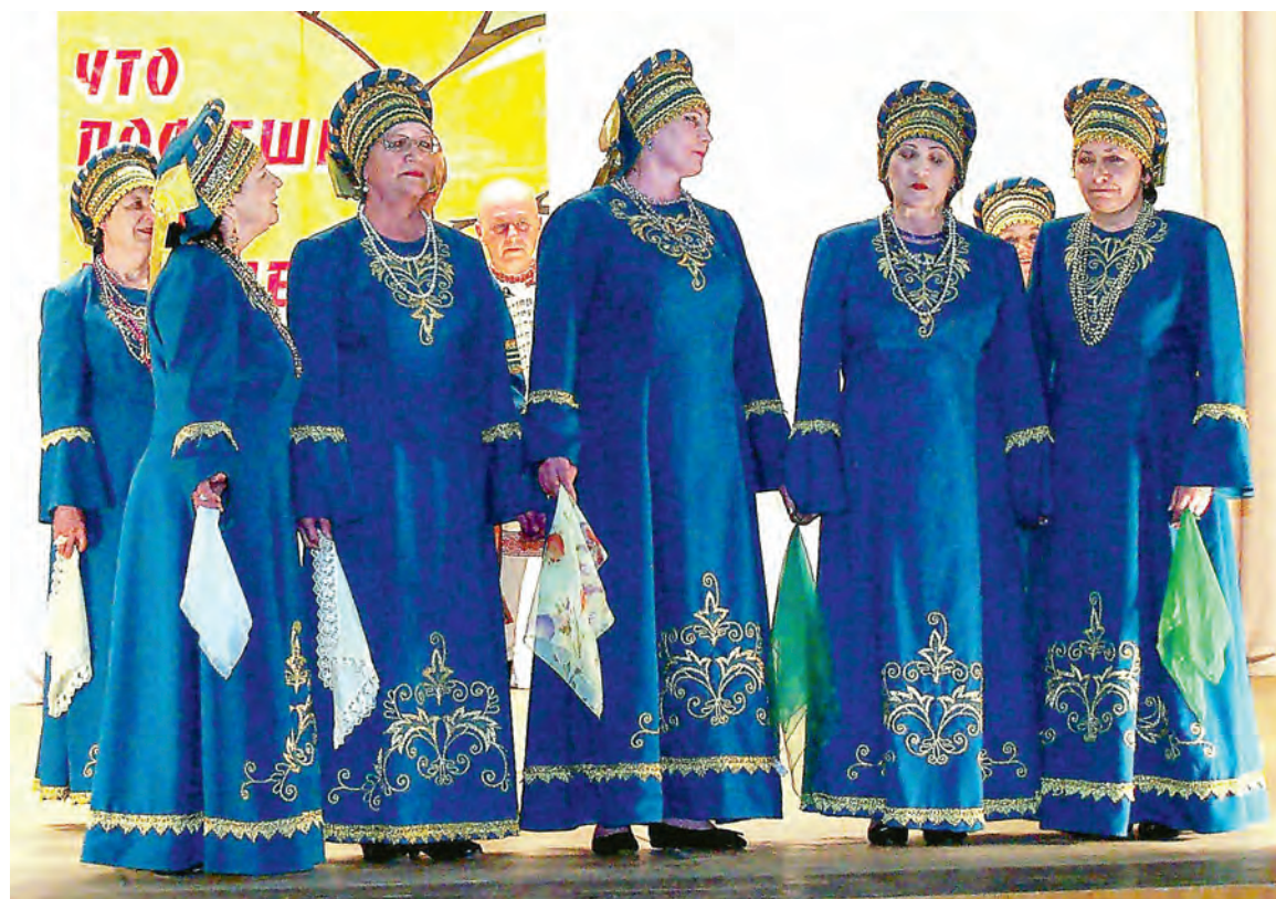
Сохранение традиций народной песни — основа деятельности ансамбля.

Беседовала Дарья Абрамова