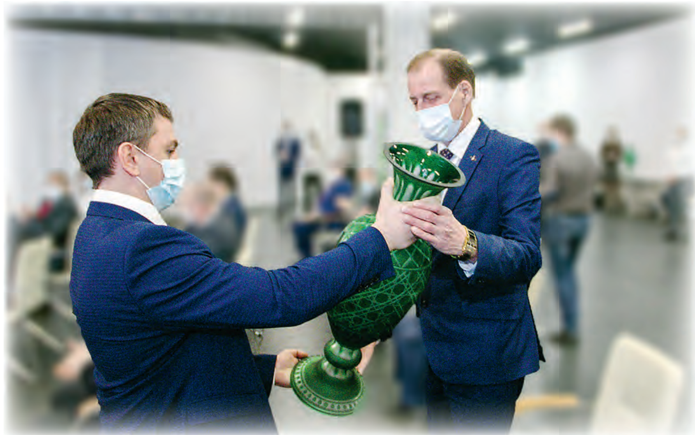
В ходе торжественной церемонии награждения.