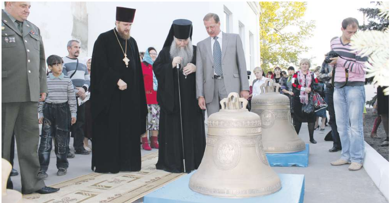
Освящение колоколов для храма. 2010 год