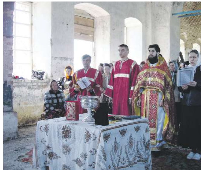
Молебен в с. Слепцовка

- Вы знаете, тяжело (улыбается). Тяжелее, чем в обычной семье. Стараемся с супругой прививать любовь к Богу с детства, вместе молимся, посещаем богослужения... Воспитываем, соблюдая известную долю строгости. Стремимся держать правильный баланс между любовью и требовательностью, боясь «перегнуть»,