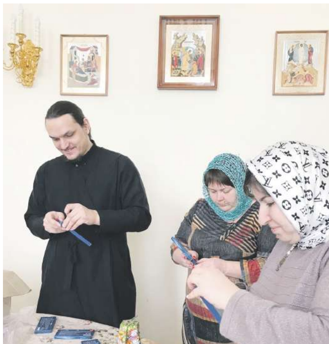
Упаковка подарков для прихожан к Рождеству Христову

страха перед смертью, которая разлучит с миром земным. Захочешь ты себе продлить жизнь на земле или пойдешь к Богу уже в вечность. Также вот такой вопрос тяжёлый».