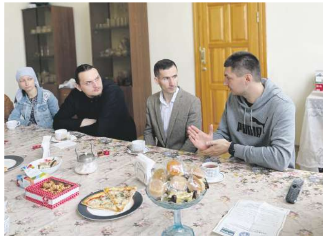
Встреча в молодежном обществе при храме

- Добрыми и отзывчивыми. Очень много добрых людей вокруг, готовых по первому зову сердца прийти на помощь, если нужно, объединиться. Вот это, наверное, самое главное. Русский придёт на помощь всегда. Сплочённость у нас в крови. На собственном опыте в этом много раз убеждался, и даже будучи ещё не священником.