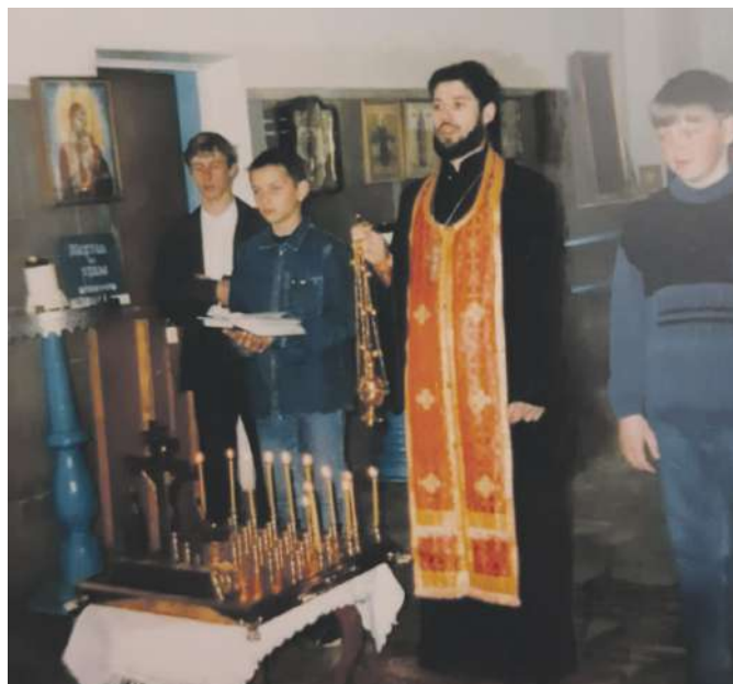
Панихида. Начало 2000-х годов

Мы спросили у настоятеля, разделяет ли он мнение, высказываемое многими русскими писателями и историками о том, что Россия и православие неотделимы друг от друга, и если умрёт православие — умрёт и Россия. Священник согласился с этим, подчеркнув, что Россия сильна православием, его лучшими духовными традициями и ценностями, которые принято называть непреходящими: верой в Бога, единством народа, почитанием семьи, бескорыстным стремлением сделать мир вокруг светлее и добрее: «В нашей стране благодаря усилиям президента и Святейшего Патриарха сейчас пытаются сохранить наши исконно-русские, православные традиции, и самое главное здесь — это сохранение веры в Бога, православно-христианского понимания высшего смысла человеческой жизни как спасения бессмертной души. Не зря говорят: «Если с нами Бог, то кто против нас». Поэтому, если с нами будет Господь, то нам никакие видимые враги не страшны».