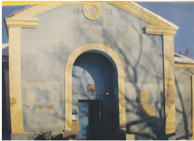
Так когда-то выглядел вход в храм