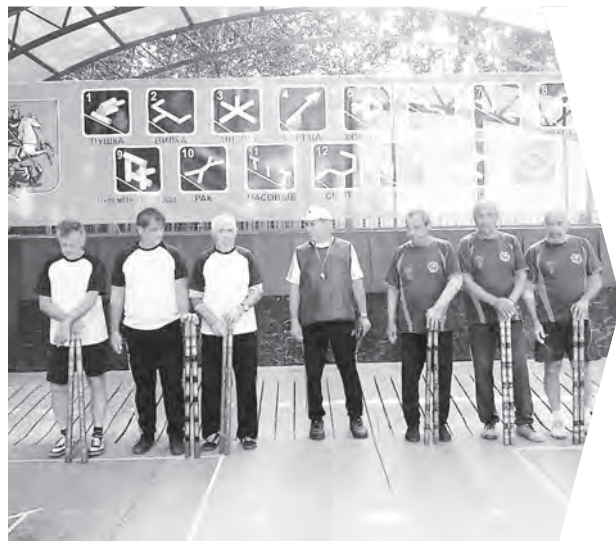
Команды г. Москвы и Саратовской области – «на старте».

Подготовила Дарья Абрамова