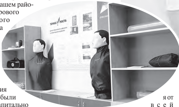
Новый центр притяжения октябрьских школьников.

роста», который поможет творить, держать — реализовать все свои творческие способности и таланты! А главными помощниками в этом станут замечательные преподаватели. Ребятам и педагогам