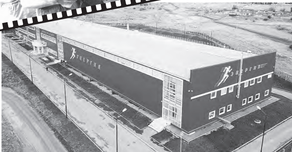
ФОК «Энергия» — современный многопрофильный спортивный комплекс.