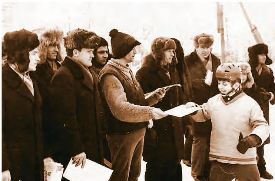
70-80-е годы XX века - расцвет массового спорта в районе. Турнир «Золотая шайба».

Исходя из отрывочных сведений, стадион развивался параллельно с лесопарком на берегу Идолги. Ответвление реки было не затокой, как сейчас, а обогнув лесистый участок, оно соединялось с главным руслом, образуя ос-