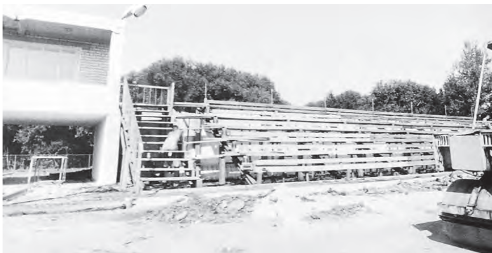
К 70-летию района стадион «Олимп» превратился в добротный спортивный объект.