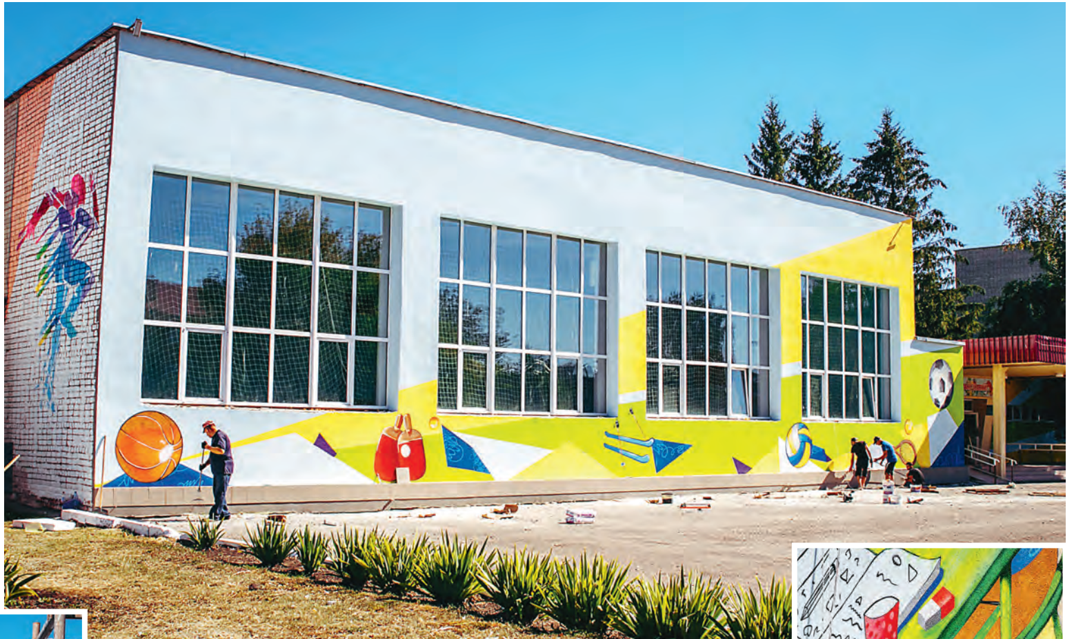
Новый облик Татищевского лицея.

В этом году стены Татищевского лицея приобрели нестандартное оформление. 1 сентября школьников встречали не только учителя и знакомые кабинеты с любимыми и родными партами, по которым все уже успели так соскучиться, но и неожиданное красочное граффити, которое появилось на фасаде учебного учреждения. Мячи, лыжи и другой спортивный инвентарь, учебники, тетради и ученик за партой, будто бы замерший в ожидании ответить на вопрос - яркими красками передают всеми любимые нами школьные будни, которых зачастую так не хватает взрослым.