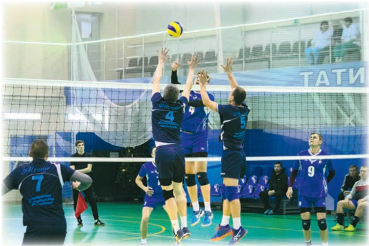
Финальные игры турнира.