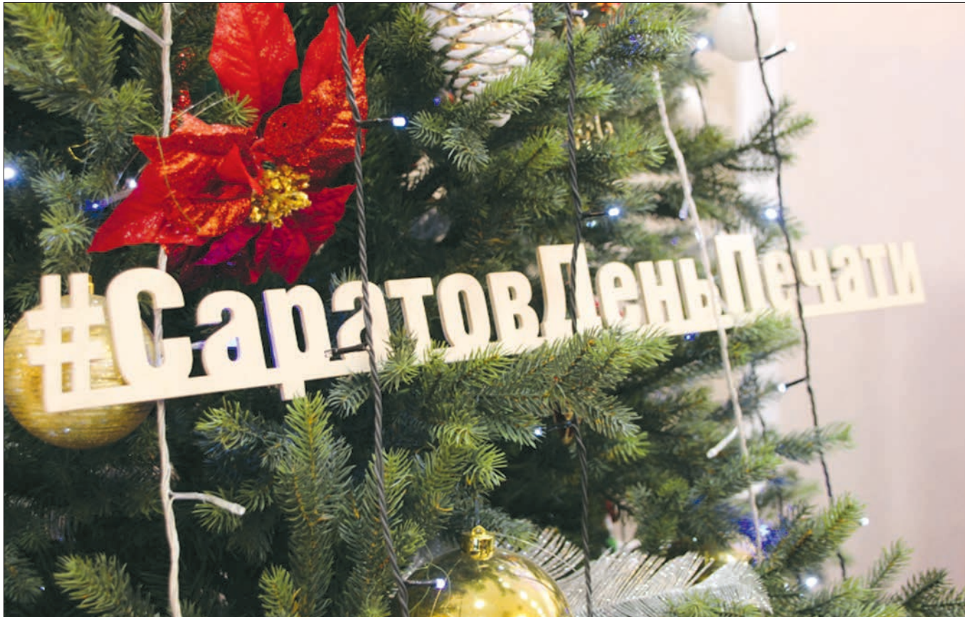
В канун Старого Нового года российские журналисты отмечают свой профессиональный праздник.