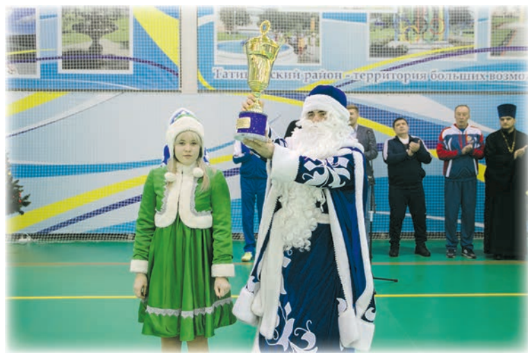
Главный приз соревнований.

Во второй подгруппе на площадке спортивного зала Татищевского лицея играли команды: Базарно-Карабулакского района, татищевская «Мечта» и «Феникс» Сторожевского муниципально-