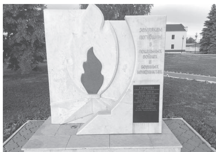
Памятник землякам, погибшим в локальных войнах и военных конфликтах, в р.п. Татищево.

Выросший в семье, где складывалась целая династия воен-