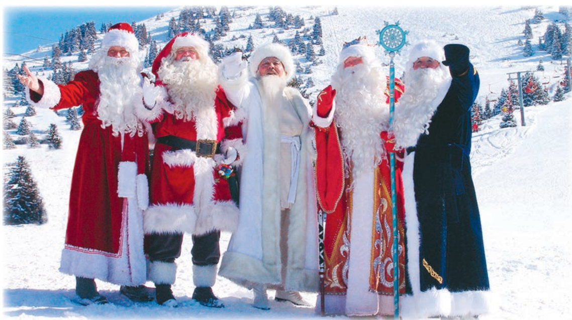
Новый год - круглый год! Выбери свой праздник.

Следующий Новый год приходит в соответствии с лунным календарем. Он не имеет фиксированной даты, поскольку отмечается в первое весеннее новолуние (между 21 января и концом февраля). Традиция встречать Новый год по лунному календарю бытует в Китае, Малайзии, Вьетнаме, Сингапуре, Корее, Монголии, а также среди приверженцев буддийской религии и в других странах. Мусульманский