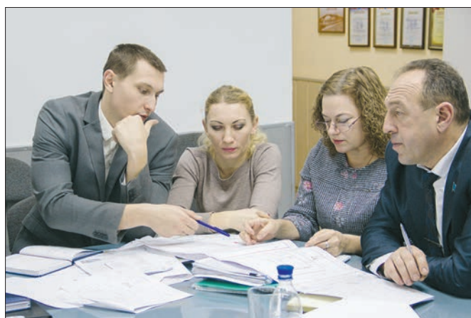
В ходе совещания.

Именно поэтому на совещании, которое длилось несколько часов, обсуждались мельчайшие детали по каждому из запланированных объектов. Ведь как бы