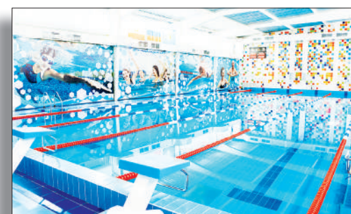
В «Энергию» — за здоровьем!