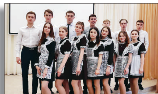
Отличие в учебе — отличие в жизни