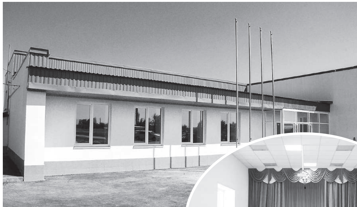
Обновленный клуб станет «душой и сердцем» села Куликовка.