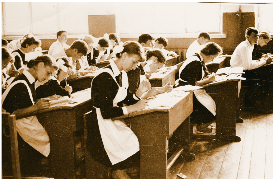
1965 год. Восьмой класс сдаёт экзамены.

1928 год. При районном отделе народного образования и отделе социального воспитания (СОЦВОСП) Татищевского районного исполнительного комитета советов рабочих и крестьянских депутатов и красной армии начинает свою работу Районная комиссия по ликвидации безграмотности и малограмотности.