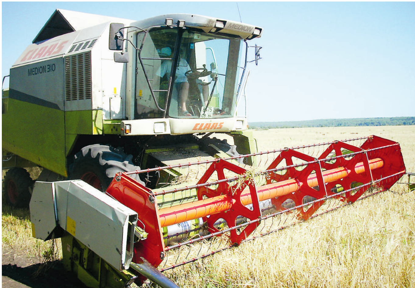
Каждый благоприятный час используется с полной отдачей. На полях ИП Калинин Ю.В.