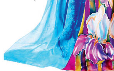
Образец палантина в технике батик.

Индонезийские изображения для батика насчитывают более трех тысяч цветовых вариаций. На ткань наносили рисунки экзотических птиц,