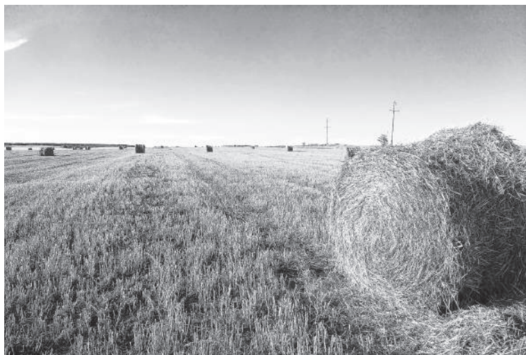
ООО «Лето 2002». Заготовка соломы.

Уборка озимых культур хозяйствами Татищевского района уже завершена. По данным управления сельского хозяйства, предпринимательства, земельных и имущественных отношений администрации