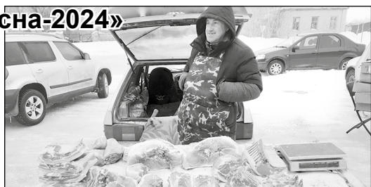
Ярмарка в с. Октябрьский Городок