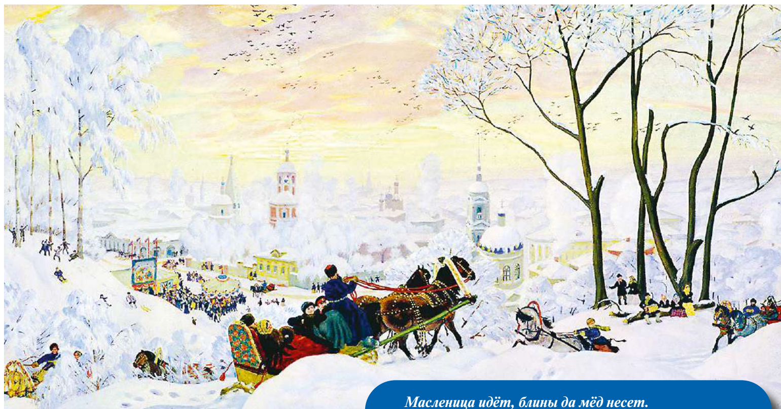
Б.М. Кустодиев «Масленица».

Масленица, один из самых зажигательных и жизнерадостных праздников славянского календаря, пышно отмечается в последнее воскресенье перед Великим постом. Праздничные гуляния и обряды заполняют целую неделю, предшествующую посту, которую также называют Сырной седмицей. Масленичная неделя в 2024 году начнется в понедельник, 11 марта, и продлится по воскресенье, 17 марта.