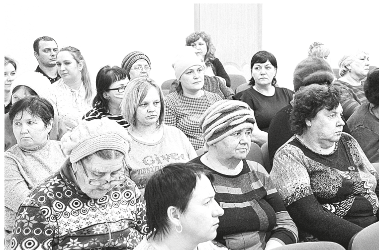
Жители с. Курдюм во время встречи с Главой.