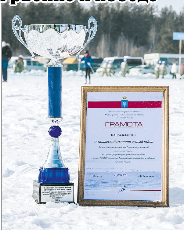
Татищевцы — самые активные участники областной лыжной гонки.

В этом году соревнования окутывал дух военных времен. Военная техника, праздничный концерт, национальные подворья, приуроченные к великому событию — и это далеко не все, что окружало участников в этот день. Каждый мог не только покататься на лыжах, но и окунуться в атмосферу прошлого, не забывая о светлом настоящем.