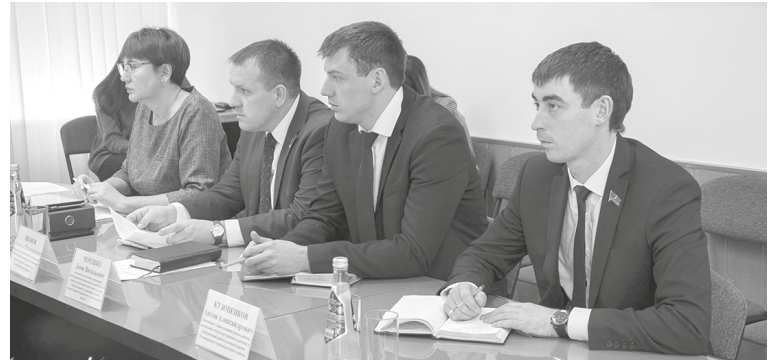
Строительство будет проходить в несколько этапов.

При этом, вариант согласованный с администрацией района, разрабатывался с учетом существующей застройки при минимальном изъятии земельных участков без построек, вариант №1 проходит по существующей жилой застройке и части садоводческого товарищества, под снос попадает восьмиквартирный жилой дом. Предварительная сумма компенсации при