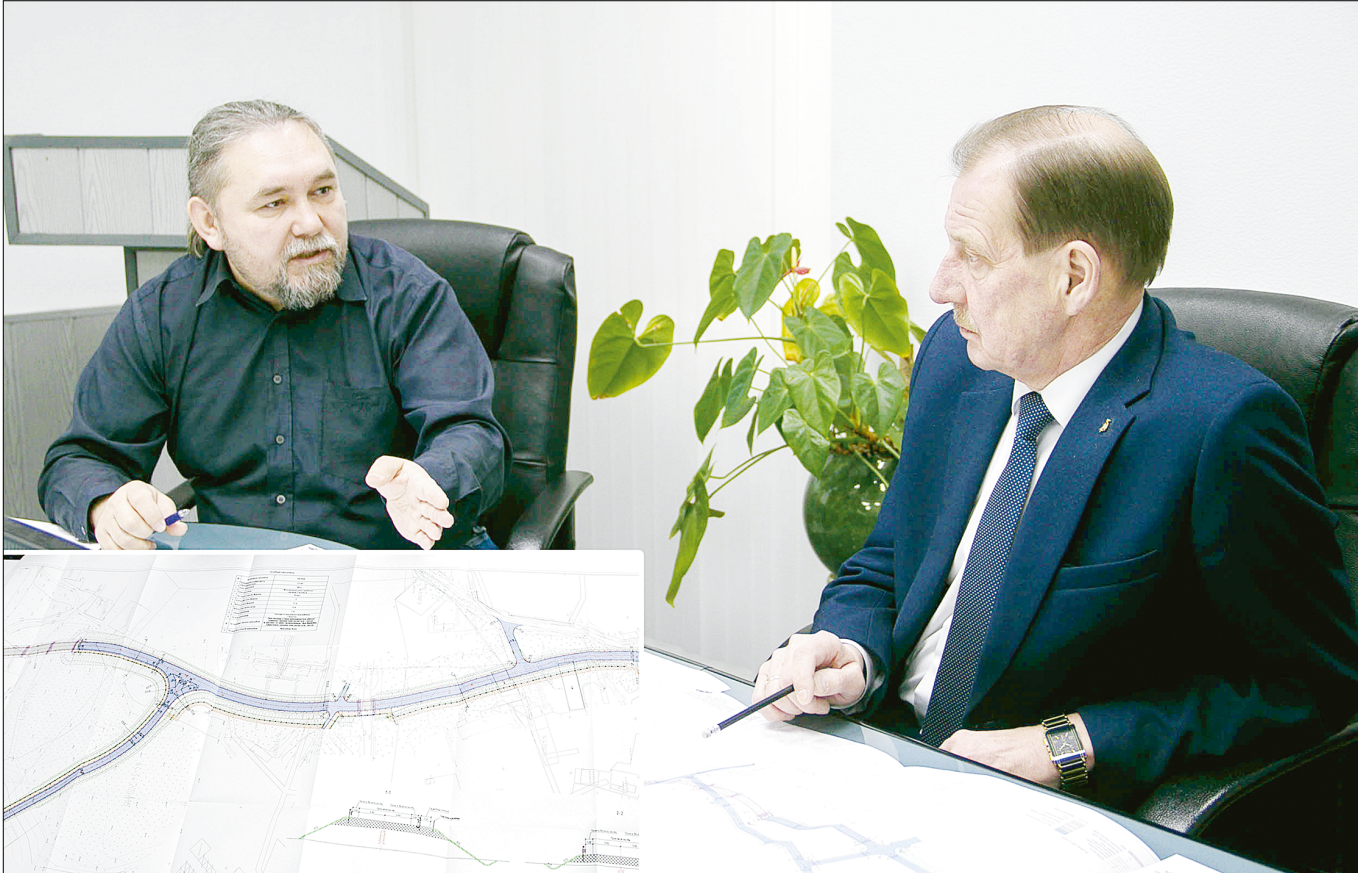
Совсем скоро проблема районного поселка, связанная с железнодорожным переездом, останется лишь в воспоминаниях.