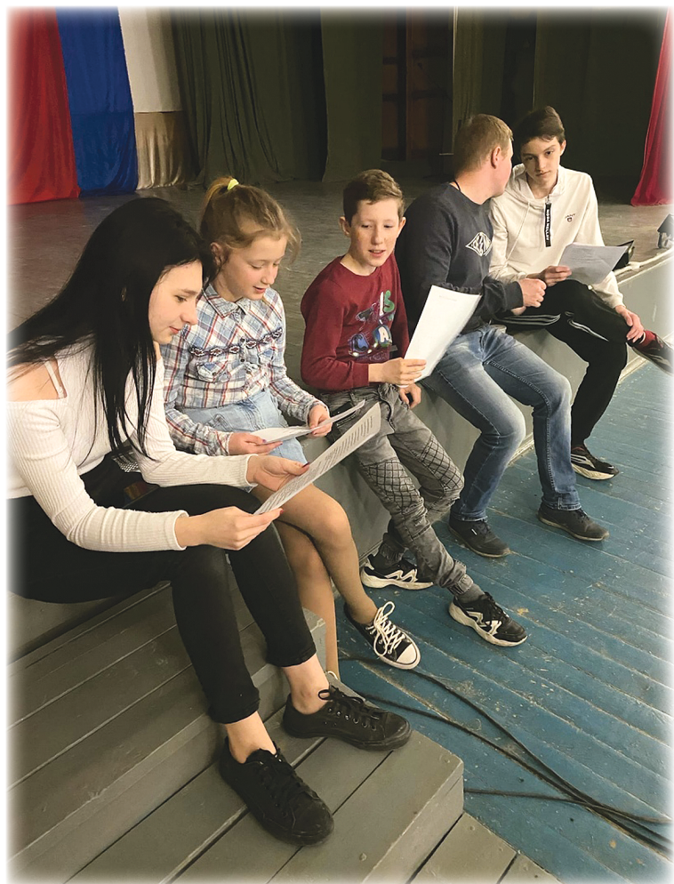
Даже КВНщику без репетиций не обойтись.