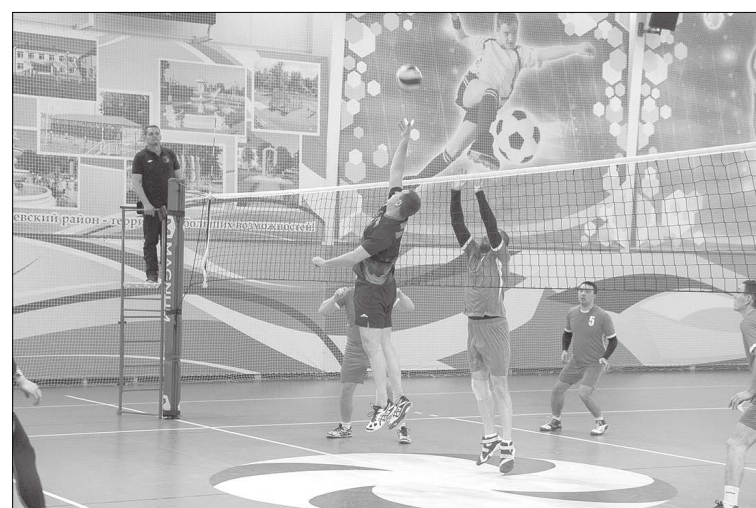
Волейбольные баталии за второе место в турнирной таблице.