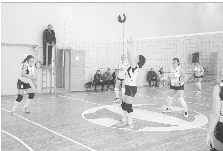
В игре команды «Поволжский ипотечный» и «Райбалл».