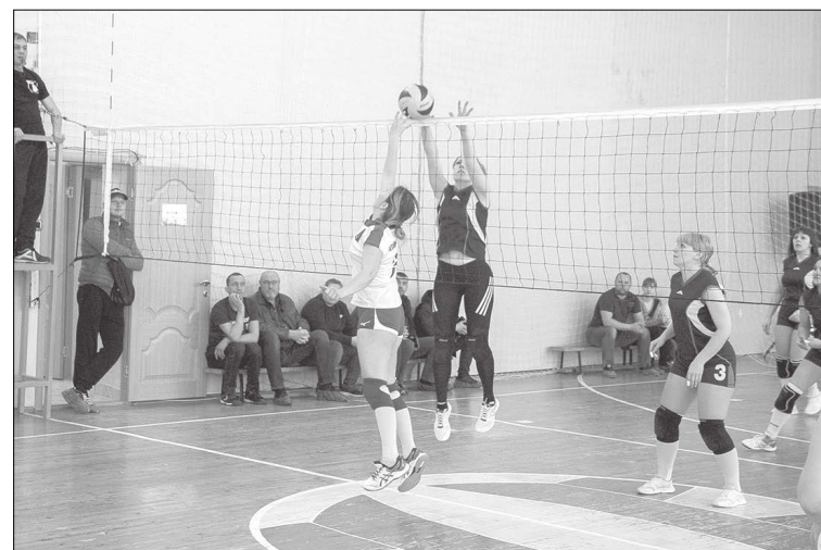
Матчи между женскими командами не менее захватывающие.

Впереди участников Соревнований на Кубок главы Татищевского муниципального района по волейболу среди мужских и женских команд сезона 2019-2020 годов ждет самое приятное - торжественная церемония награждения.