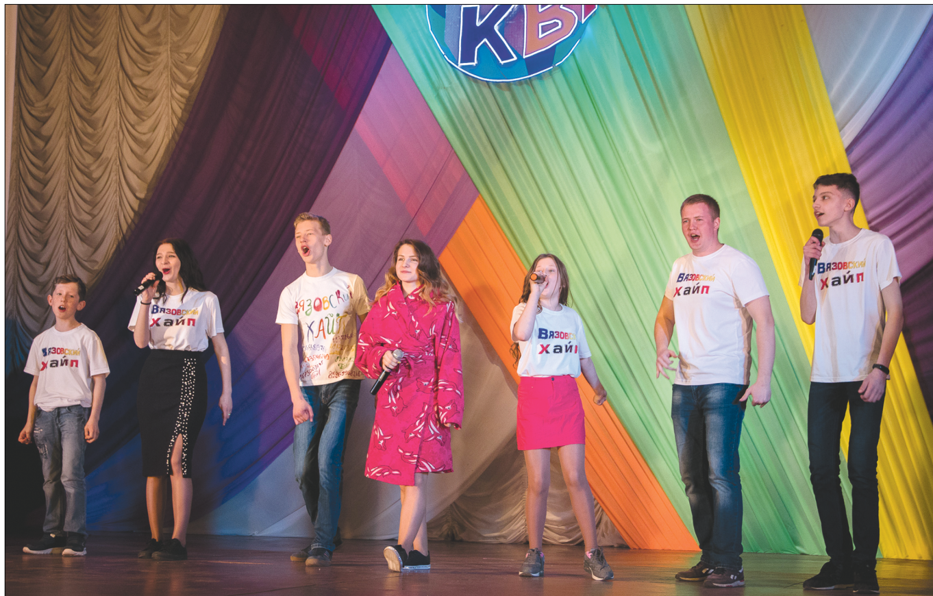
«Вязовский хайп». Финал игр КВН сезона 2018-2019.