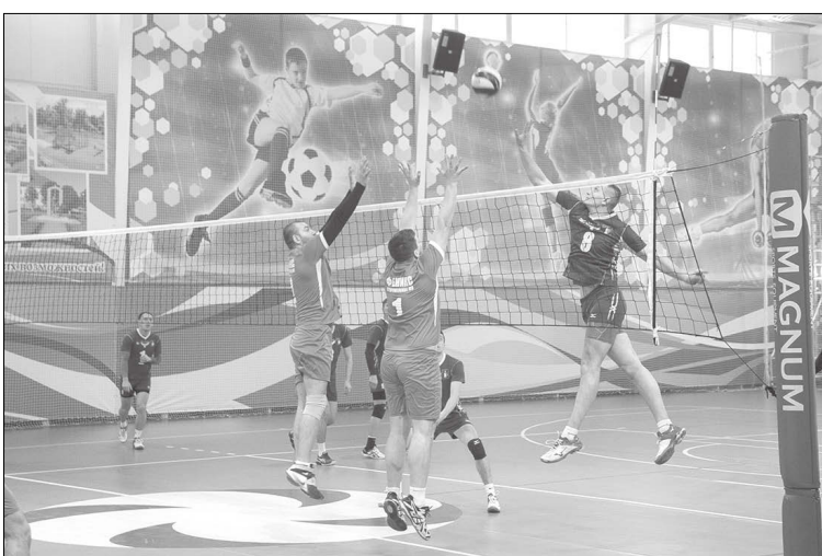
Матч между командами «АльТаиР» и «Феникс».