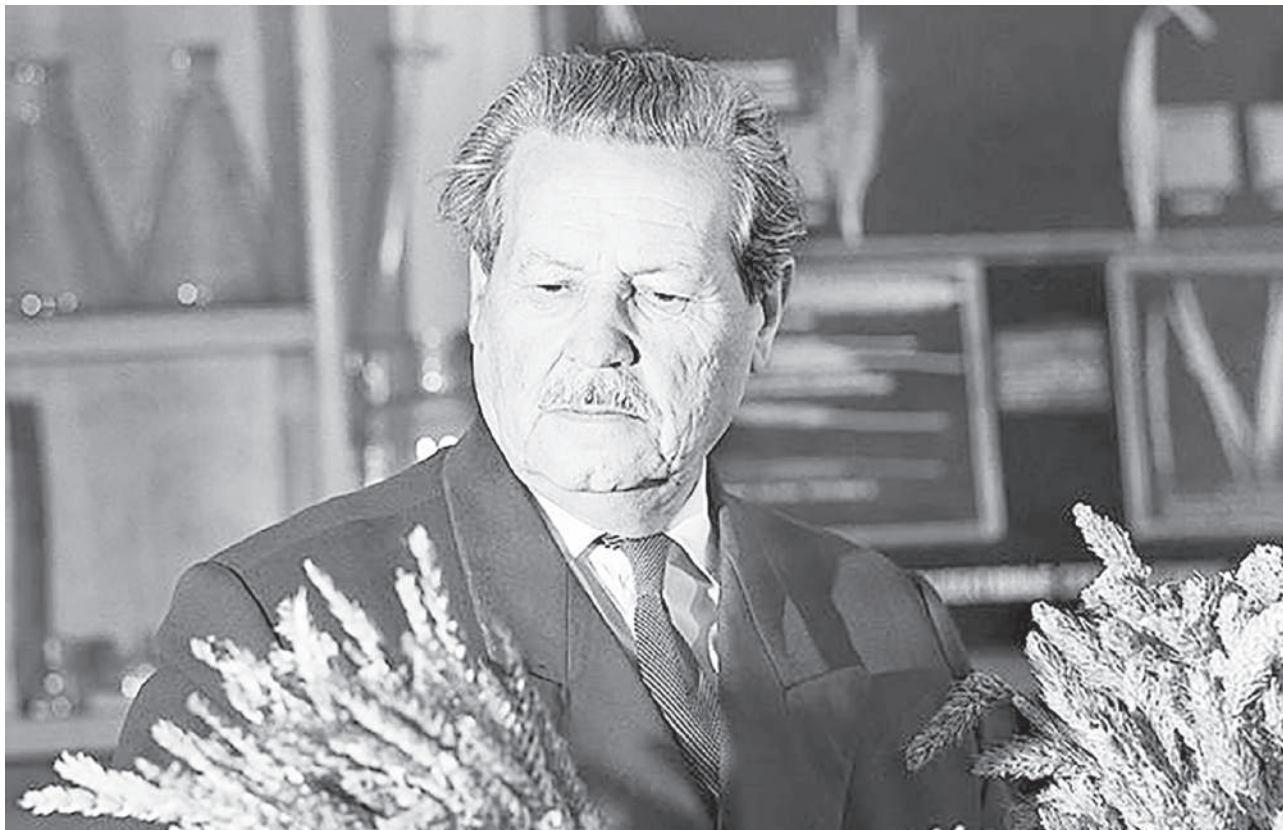
Цицин Николай Васильевич.

С 1932 года Н.В. Цицин работал заведующим лабораторией пшенично-пырейных гибридов на Омской зональной опытной станции, реорганизованной в 1933 году в Сибирский научно-исследовательский институт зернового хозяйства в г. Омске. В 1936–1938 годах занимал пост директора института.