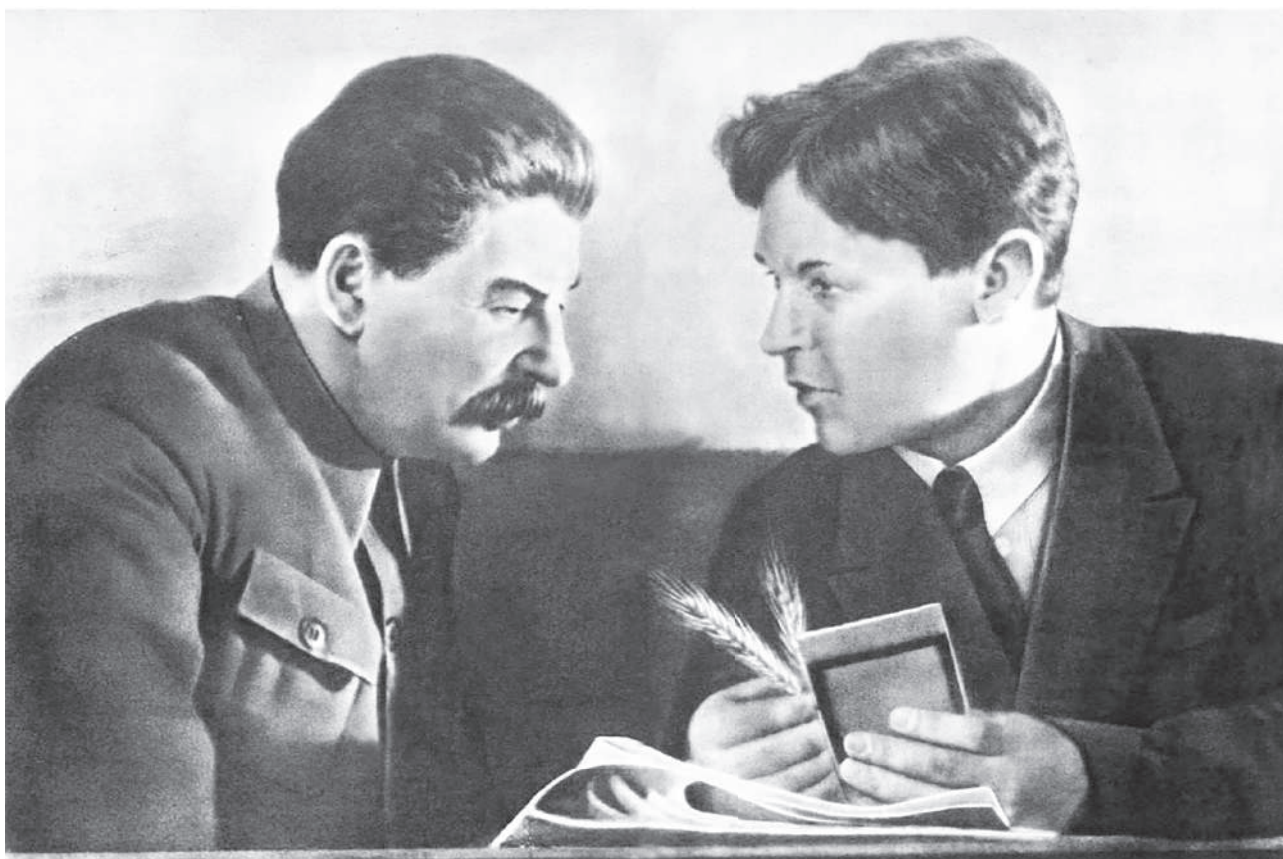
Цицин и Сталин на втором съезде колхозников-ударников, 1935 год

Делегат XX-го съезда КПСС. Депутат Верховного Совета