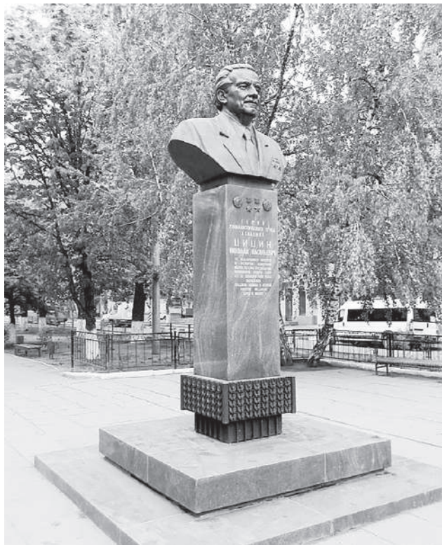
Памятник Цицину Н.В. (г. Саратов, ул. Рахова).