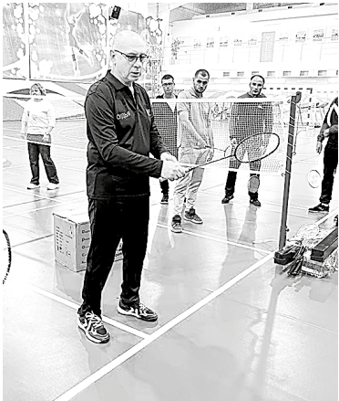
Физической культуры Татищевского, Лысогорского, Калининского, Самойловского, Красноармейского, Аткарского муниципальных районов, ЗАТО «Светлый». В рамках мероприятия Федерация бадминтона Саратовской области провела семинар, посвященный развитию школьного бадминтона. Участники поблагодарили организаторов и руководство района за поддержку мероприятия. Докладчики обсудили важность бадминтона в формировании здорового образа жизни учащихся, его использование в учебной и внеклассной деятельности, включая коррекционные занятия. Были даны рекомендации по проведению региональных соревнований и оборудованию площадок. Мастер-классы показали методы тренировки с элементами бадминтона для улучшения зрения.

На базе ФОК «Энергия» р.п.Татищево был проведен 5-й зональный семинар по вопросам эффективного взаимодействия представителей организационных комитетов муниципальных и зонального этапов Всероссийских соревнований по бадминтону «Проблема» среди обучающихся общеобразовательных организаций, организационно-методического сопровождения развития бадминтона в рамках урочной, внеурочной деятельности и дополнительного образования. Организаторами мероприятия выступили Национальная федерация бадминтона России, министерство спорта Саратовской области, СРО ФСО «Федерация бадминтона Саратовской области», ГБУ ДО СО «Спортивная школа олимпийского резерва «Олимпийские ракетки», администрация Татищевского муниципального района. Участники: ответственные представители от организационных комитетов, руководители методических объединений учителей физической культуры и учителя