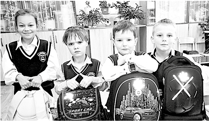
Уроки дорожной грамотности в школе с. Вязовка

На территории Татищевского района пройдут мероприятия, направленные на информирование населения о неукосительном соблюдении правил дорожного движения в период осенних школьных каникул, когда дети особенно подвержены риску дорожно-транспортной аварийности. Сотрудники Госавтоинспекции проведут профилактические мероприятия с учащимися и воспитанниками образовательных учреждений. В общем деле профилактики детского дорожно-транспортного травматизма объединятся педагоги образовательных организаций, представители родительской общественности, а также работники учреждений сферы дополнительного образования. Особое внимание личного состава отделения ГИБДД нацелено на проведение профилактических мероприятий, направленных на популяризацию использования световозвращающих элементов на одежде, безопасность несовершеннолетних на улично-дорожной сети, на предотвращение нарушений Правил дорожного движения со стороны детей и взрослых. Сотрудники Госавтоинспекции обращаются к родителям и взрослым участникам дорожного движения с просьбой быть более внимательными, бдительными в вопросах обеспечения детской безопасности. Быть аккуратными и дисциплинированными водителями и пешеходами в глазах подрастающего поколения, подавать им правильный пример, а также постоянно напоминать детям и подросткам о соблюдении ПДД. Только совместными усилиями мы сможем уберечь жизни наших детей на дороге. Соблюдайте Правила дорожного движения, берегите себя и окружающих!