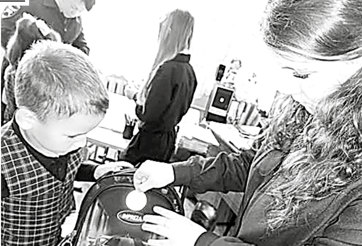
Отряд ЮИД «Дорожный дозор» школы с. Октябрьский городок призвал всех соблюдать Правила дорожного движения и в тёмное время суток использовать световозвращающие элементы на одежде, обуви, рюкзаках.