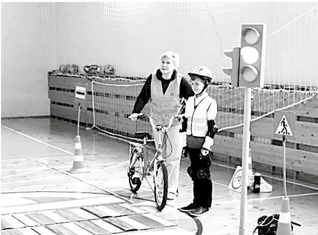
Сотрудниками передвижного комплекса «Лаборатория безопасности» совместно с Госавтоинспекцией в школе села Мизино-Латиновка проведены тематические уроки дорожной грамотности для учащихся 1-5 классов.