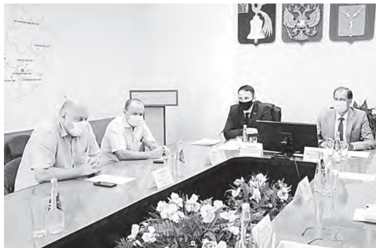
Очередное заседание оперативного штаба.

Такие данные были озвучены в ходе очередного заседания оперативного штаба по снижению рисков завоза и распространения на территории района новой коронавирусной инфекции под председательством главы Татищевского муниципального района П.В.