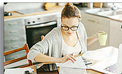
Статус — самозанятый