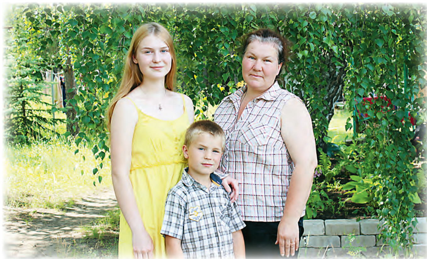
Большая и дружная семья — это счастье!