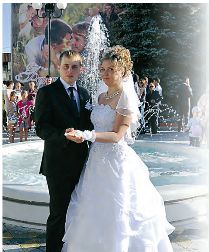
Свадебное фото в сквере «У фонтана» — одна из традиций татищевских молодоженов.