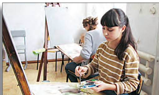
Выпускники о школе, об искусстве, о себе