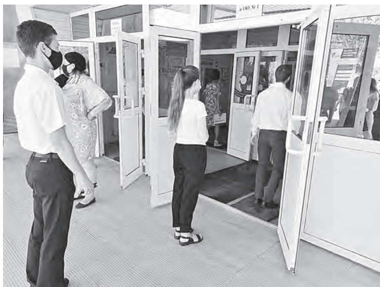
Результаты экзамена станут известны примерно через 10-14 дней.

Самый массовый экзамен — по русскому языку — в связи с необходимостью рекомендаций Роспотребнадзора прошел в два дня 6 и 7 июля с соблюдением всех мер безопасности.