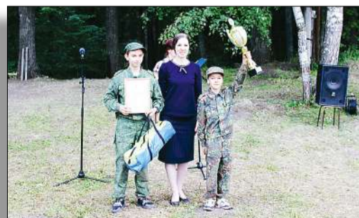
Турслет - 2022