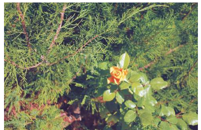
Взлелеянная роза в саду учителя

- Самое главное качество учителя, на мой взгляд - любить свою работу и любить детей, а не самого себя в своей работе, а то ничего хорошего не получится.