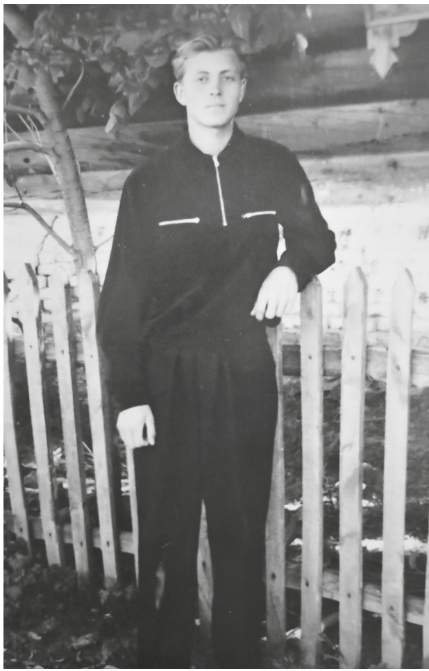
Владимир Васильевич после окончания школы

после окончания вуза стал директором. При нём Вязовская школа стала известна своими успехами на всю область.