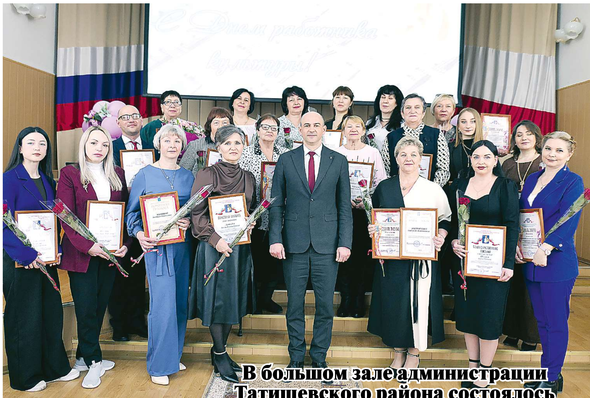
В большом зале администрации Татищевского района состоялось