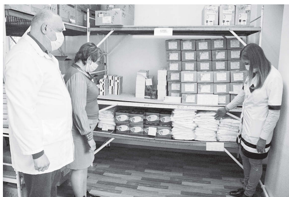
Татищевская районная больница обеспечена всем необходимым.