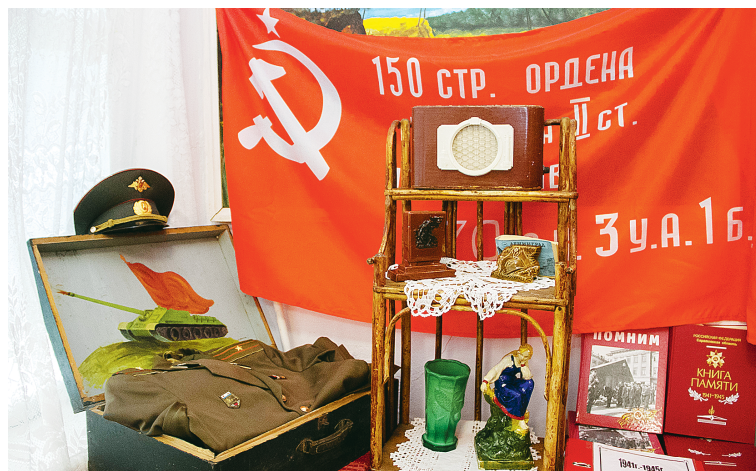
История Великой Отечественной войны представлена сквозь взгляд учеников и учителей школы.