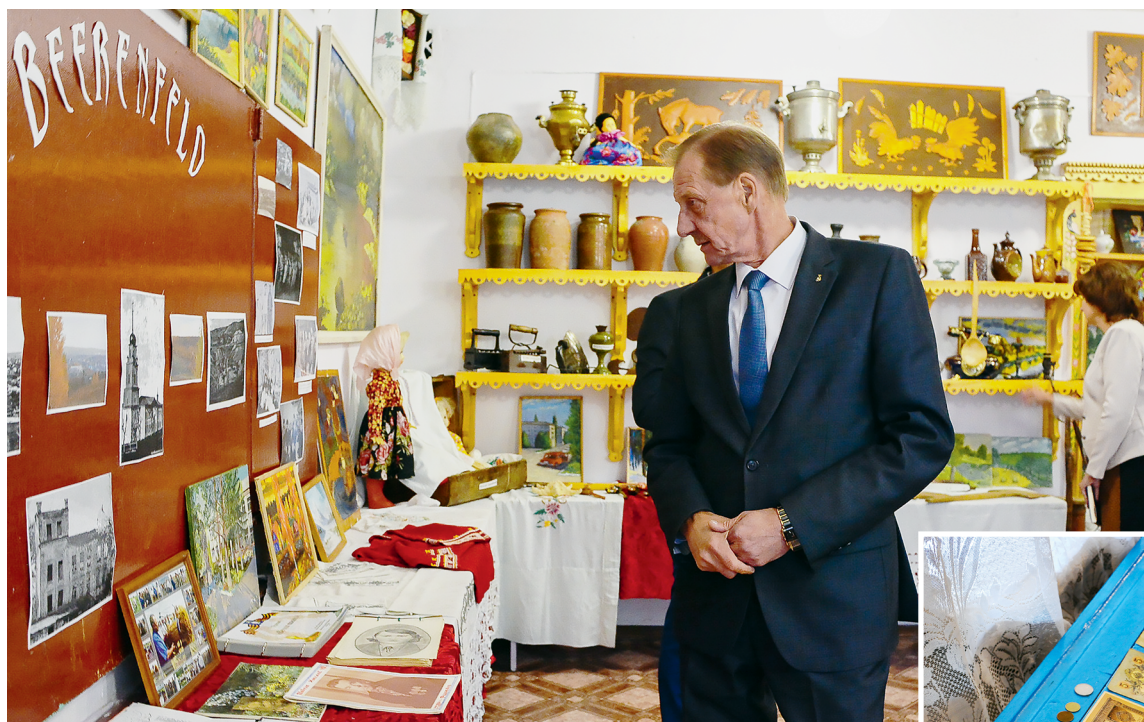
Музей является связующим звеном между прошлым и будущим. Он популярен не только у местных жителей, с удовольствием принимает гостей и ждет новых посетителей!