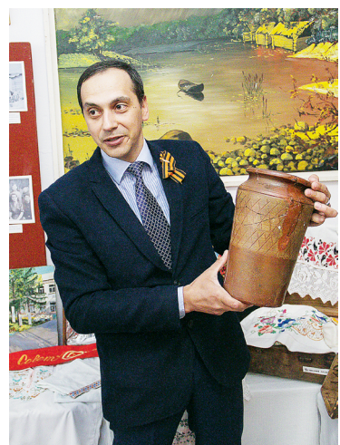
Реставрация объектов выставки — одна из ключевых в работе музея.

- Года два назад к нам приезжали из Германии, гости хотели увидеть свои корни. Собирали материал