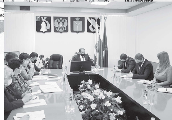
В ходе рабочего совещания.

Теперь же начнется, наверное, самое главное, – реконструкция системы водоснабжения посёлка