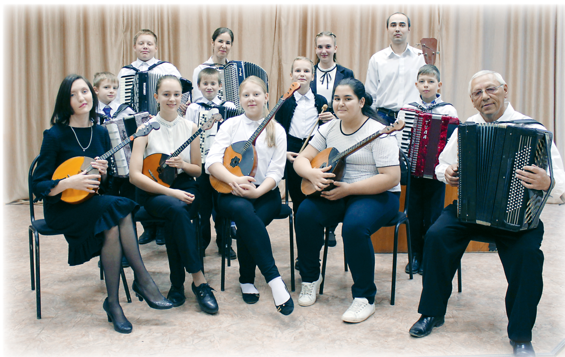
Оркестр народных инструментов.

- Аккордеон — это более эстрадный инструмент, выбирать его нужно тем, кому нравится эстрада. Я влюбился в аккордеон, когда мне было 7 лет. И только в 10 лет меня взяли в первый класс музыкальной школы. Мне нравится совершенствоваться