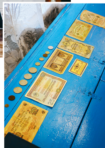
Старинные монеты — один из самых ценных экспонатов.

Беседовала Анна Чикунова, фото Кирилла Неумыткова