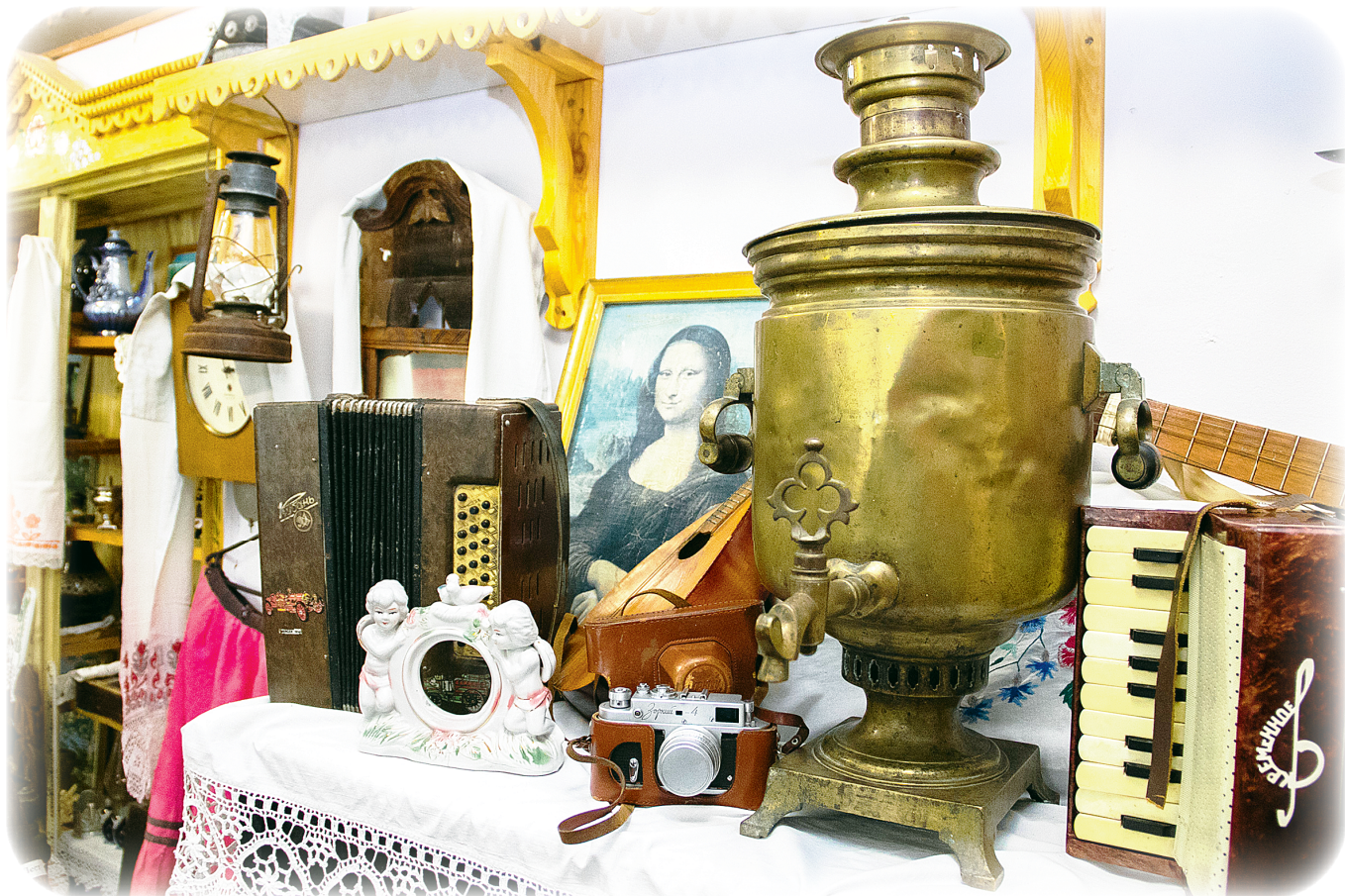
Музей в Ягодной Поляне появился и живёт благодаря неравнодушным к истории родного края землякам.