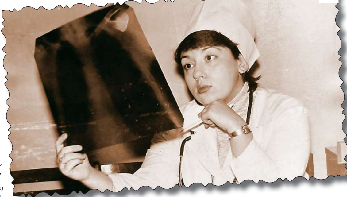
Практические занятия в институте.

— Пожалуй, самые любимые мои пациенты — дети в возрасте до одного года, — рассказывает врач. — Запеленатый новорожденный младенец похож на кулек длиной в пятьдесят сантиметров. Наблюдаешь, как