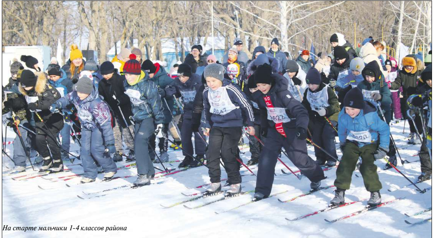
На старте мальчики 1-4 классов района

После объявленного гонкам старта лыжники отправились навстречу новым спортивным рекордам.