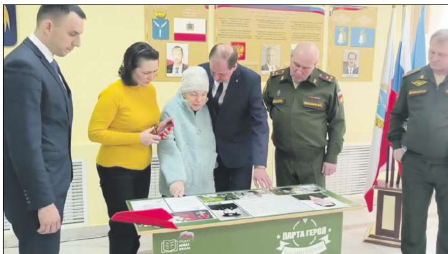
Открытие Парты Героя в с. Сторожевка