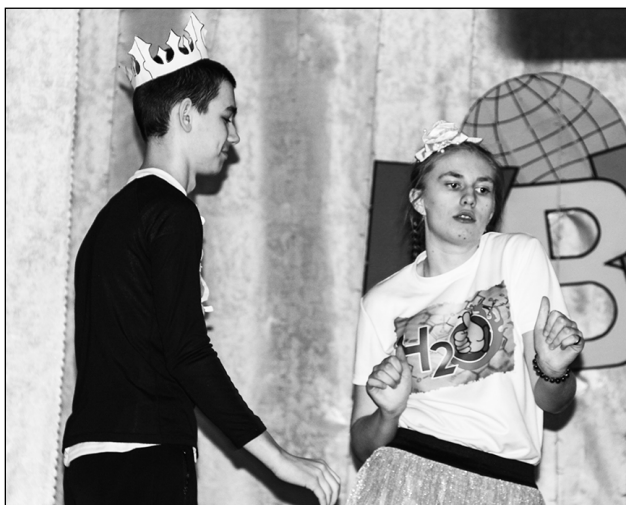
Команда КВН «Аш-Два-Во!» с. Сторожевка

В минувшие выходные прошли полуфинальные игры Татищевской лиги КВН, в которых приняли участие 8 молодежных команд района.