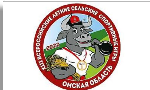
В центре событий