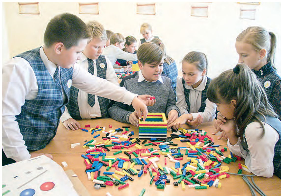
Для юных исследователей теперь открыт целый мир инженерно-технического творчества.