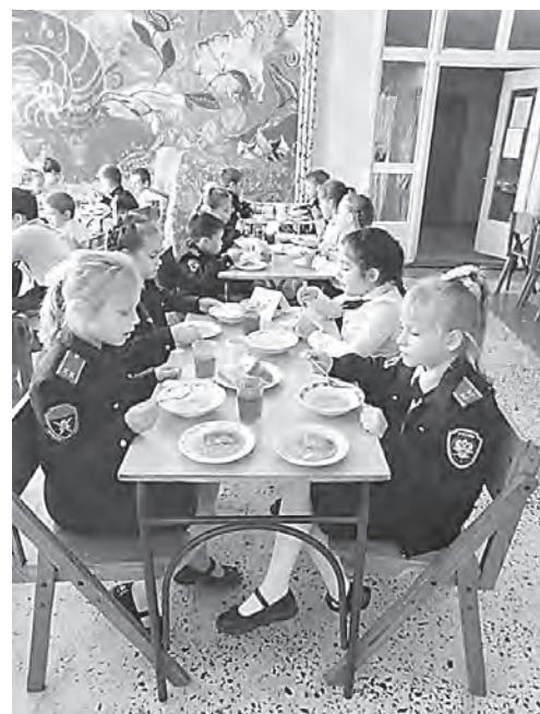
Правильное питание школьника — залог его здоровья.

Правильное сбалансированное питание — залог полноценного развития будущего школьника, строительный материал для формирования полноценного роста, развития детского организма. Какими приходят в школу дети, во многом зависит от дошкольных учреждений. И тогда, став взрослыми, они уже будут понимать, что едят, зачем едят, почему едят, у них сформируется потребность в здоровой еде. Кроме того, школьное меню может стать своеобразной методичкой, с помощью которой и вся семья постепенно