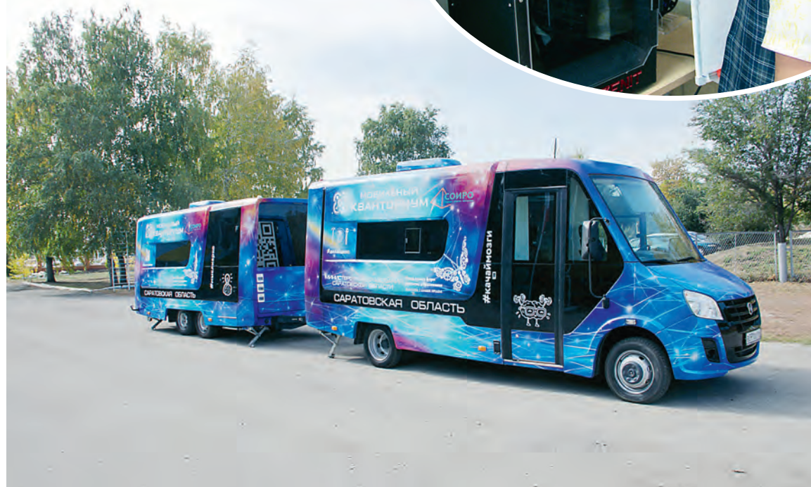
Мобильная передвижная лаборатория «Кванториум» в нашем районе работает впервые.

Александра Тупыленко