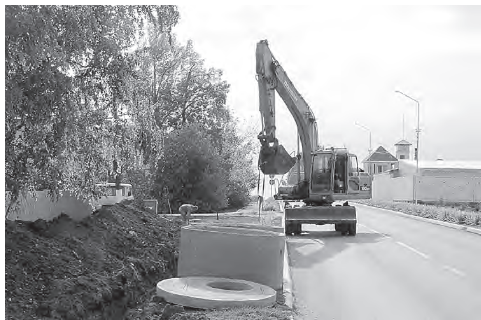
В настоящее время коммунальные работы идут по ул. Красноармейская.