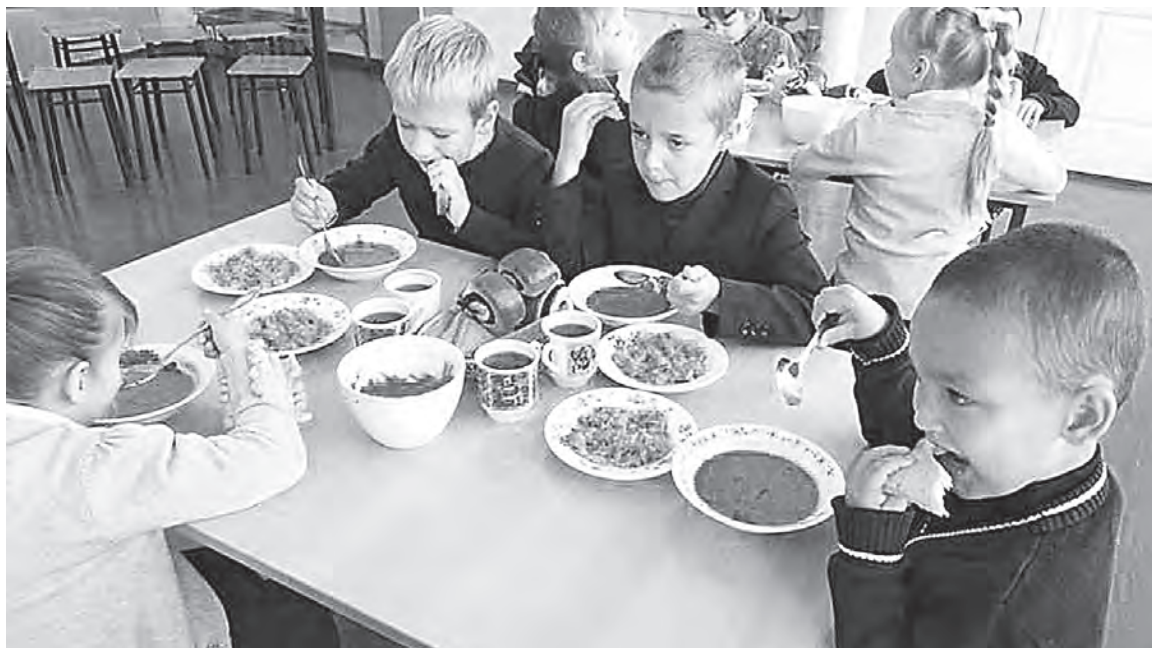
С 1 сентября «школьные обеды» для учеников 1-4 классов бесплатные.

Организация горячего питания в муниципальных образовательных учреждениях Татищевского района стала центральным вопросом повестки дня очередного аппаратного совещания при главе муниципального района.