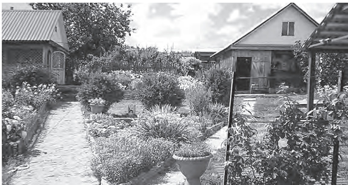
Благоустроенные и ухоженные территории населенных пунктов района — лучшая награда.