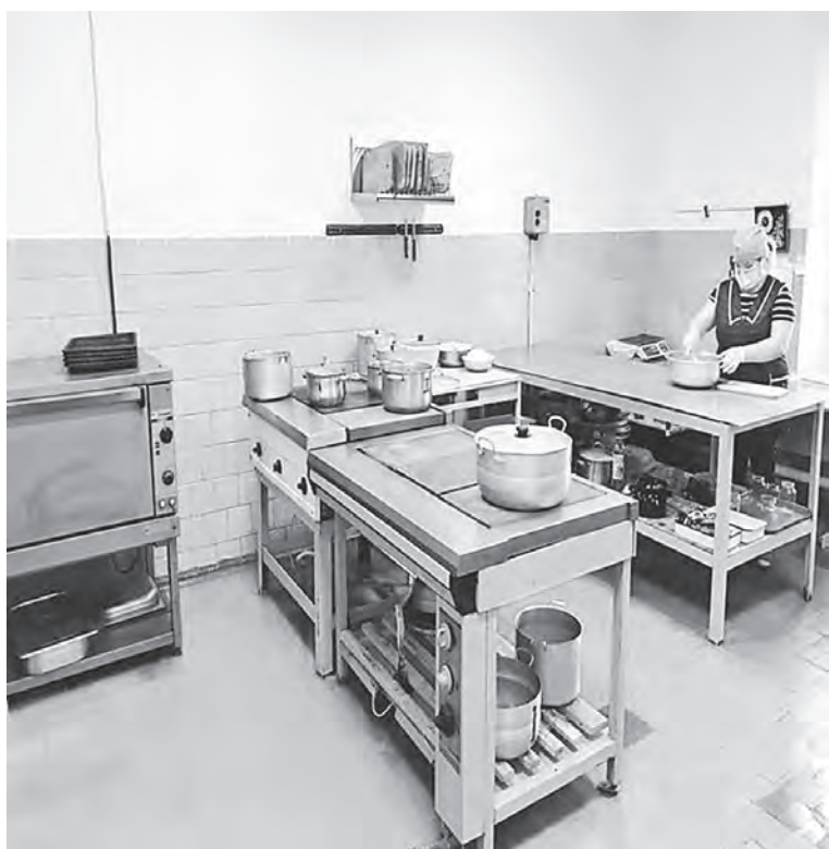
Пищеблоки — на особом контроле.