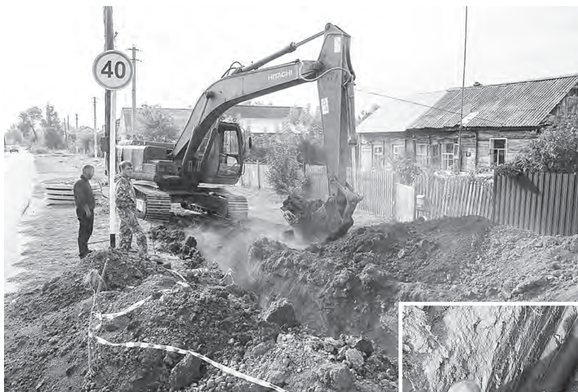
Реконструкция водопроводной сети идет на ул. Чапаева.

В ходе выполнения работ подрядчиками произведены обязательства новой скважины №1 возле пруда Михайловский, чистка существующих и установка новых колодцев (в количестве 24 штук) от скважины №1 до улицы Лапшова, замена запорно-регулирующей арматуры, установка муфтовых соединений, ремонт существующих скважин (скважина на водозаборе «Полигон», скважина на улице Шигаева, скважина в п. Северный) с заменой водоподъемных штанг и насосов, а также замена силового кабеля, опрессовка и промывка трубопроводов, замена участков трубопроводов протяженностью 886 метров (диаметр трубы 225 мм). Если более