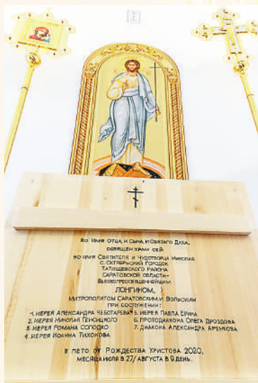
На снимках: Чин Великого освящения нового храма.