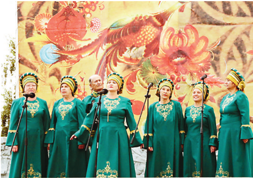
Щедра талантами Татищевская земля!

Культпоход за ликвидацию неграмотности перерос в борьбу с агрономической и технической неграмотностью, важнейшим