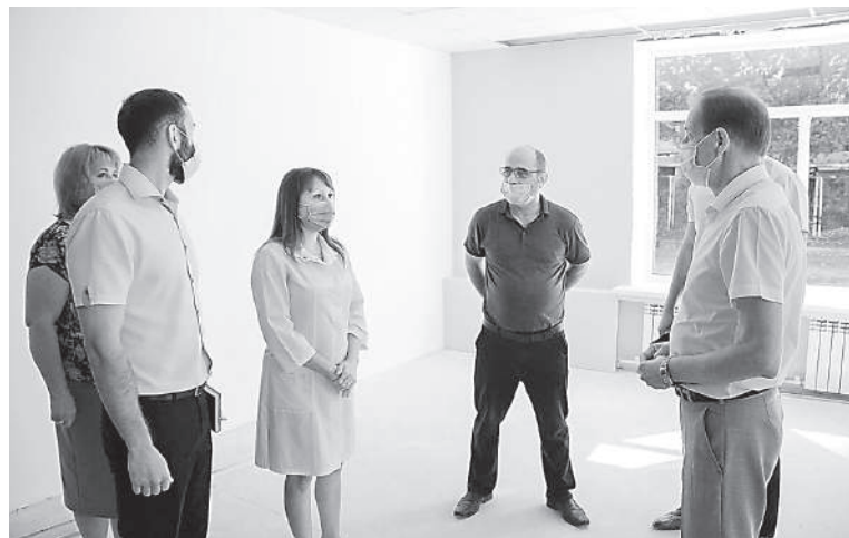
В ходе инспекционной поездки.

В детском саду, где подходят к завершению ремонтно-восстановительные работы помещения старшей группы «А», Глава встретился с представителями подрядной организации (ИП Алигаев) и оценил качество выполненных работ.