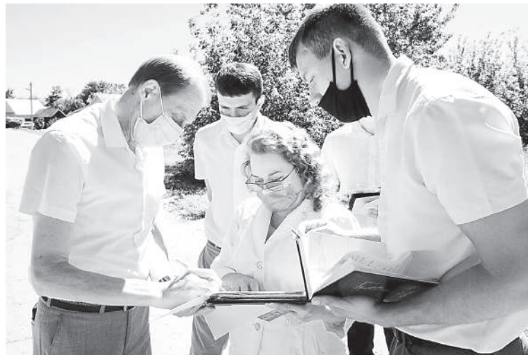
Обсуждая этапы благоустройства.

На нынешнем пустыре на следующий год в память о формировавшихся на территории нашего района в годы Великой