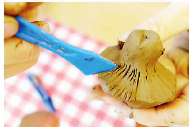
Насечки на внутренней стороне шляпки — для реалистичности.

- готовое изделие сушите 1-2 дня, поставив на полку или в коробку, избегая прямых солнечных лучей и сквозняка.