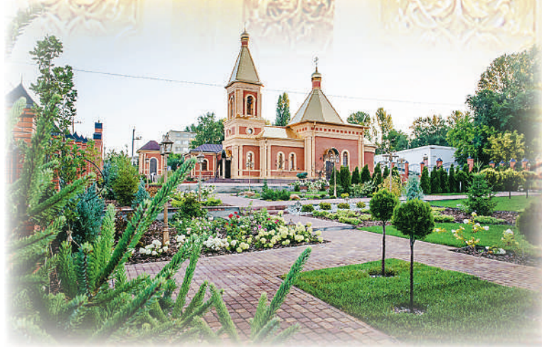
Новый храм и его территория — «райский уголок» Октябрьского Городка.

Дарья Абрамова