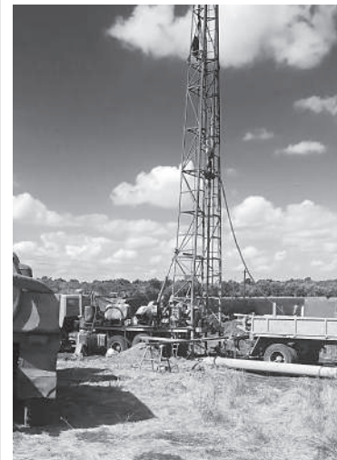
Идет ремонт водопровода.

В настоящее время подрядной организацией пробурена артезианская скважина на водозаборе «Полигон», проводятся работы по замене трубопроводов от каптажа до автодороги Тамбов – Ртищево – Саратов, а также осуществляется подготовка по замене трубопровода методом горизонтального бурения через два русла реки Идолга протяженностью около 300 метров с установкой смотровых колодцев и заменой запорной-регулирующей арматуры.