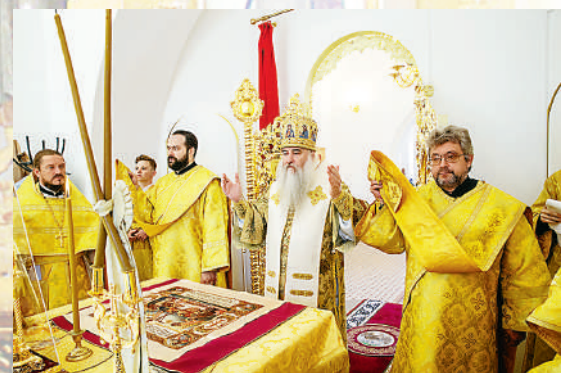
Первая служба в Свято-Никольском храме.

— Спасибо Вам за отношение к нашей земле, за то, что Вы бесконечно добрый человек с большим сердцем — помогаете нам обрести самих себя.