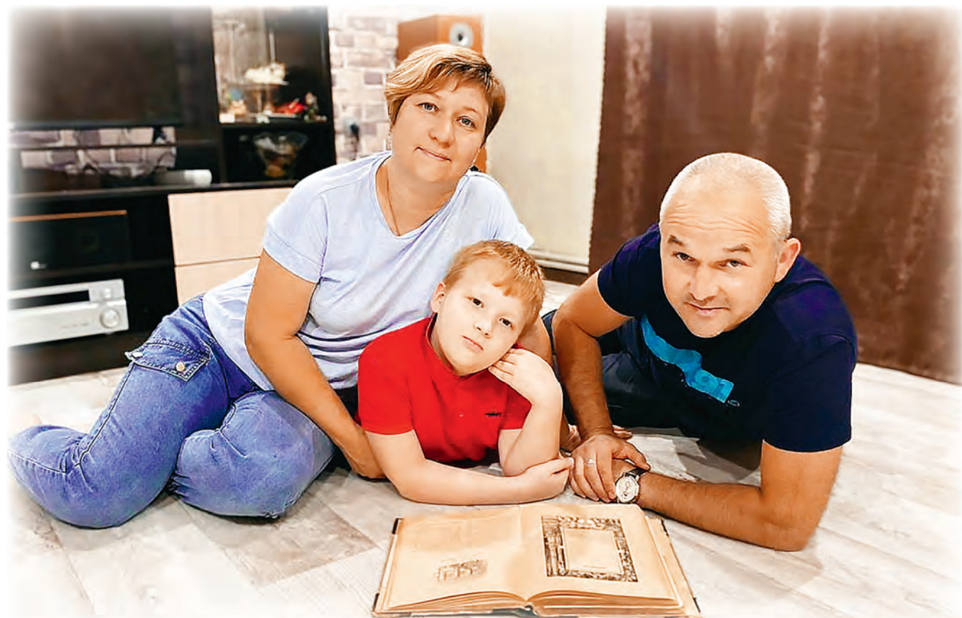
Семейное чтение — атмосфера внимания, любви и заботы.