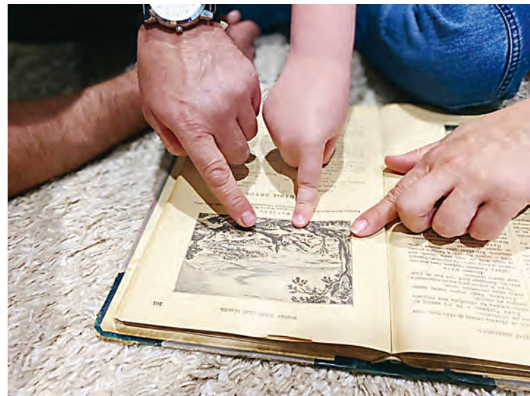
На книжных полках подчас хранятся настоящие сокровища!

В своих руках я держала второй экземпляр серии из пяти томов, которые выпускались под названием «Полное собрание