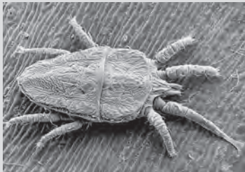
Чесоточный клещ под микроскопом.

Чесоткой можно заразиться при прямом контакте с больным, через одежду, постель или вещи, которыми пользовался больной, в бане или душе, в парикмахерской (при использовании грязного белья, инструментов). Клещ может передаваться через игрушки, спортивный инвентарь, письменные принадлежности.