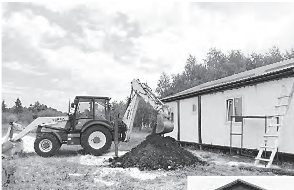
Работы по установке модульного ФАПа в с. Большая Ивановка.

В Татищевском районе продолжается возведение современных модульных медицинских учреждений. Теперь и в селе Большая Ивановка установлено здание модульного фельдшерско-акушерского пункта. Это современное, качественное, новое и доступное решение оказания медицинской помощи в первичном звене.