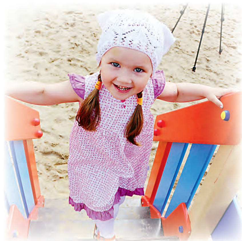
Задача взрослых - постоянно напоминать детям правила безопасного поведения и самим их соблюдать.

Уважаемые родители, понятно, что ежедневные хлопоты отвлекают вас, но не забывайте, что вашим детям нужна помощь и внимание, особенно в летний период. Безопасность жизни детей на водных объектах во многих случаях зависит только от ВАС!