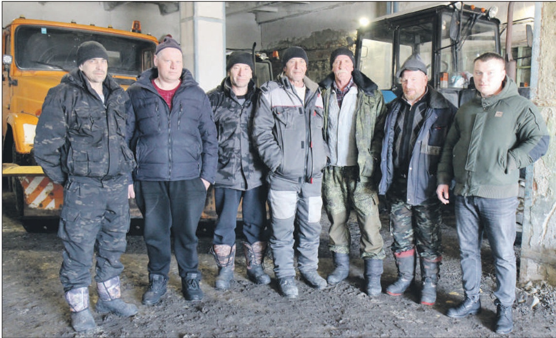
Сотрудники транспортной службы МАУ «Комфортный Город»

В настоящее время МАУ «Комфортный Город» включает в себя несколько отделов: транспортная служба, в которой трудятся 10 человек; служба благоустройства, где работает 12 человек; инженер-