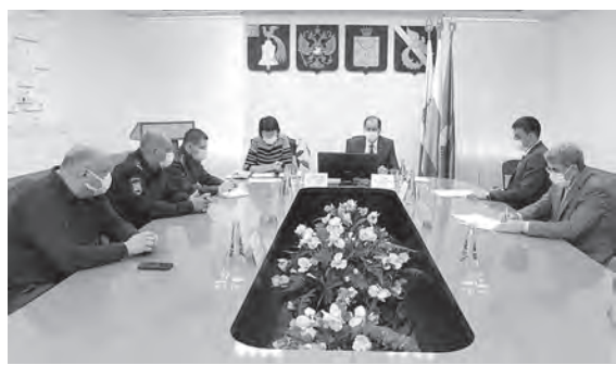
В ходе заседания оперативного штаба.

Чтобы не повторять «весенний» сценарий развития ситуации, когда практически все учреждения были закрыты, а больницы переполнены, сейчас нужно как никогда соблюдать меры предосторожности. Правда далеко не все это понимают. Именно поэтому количество рейдовых мероприятий не снижается.