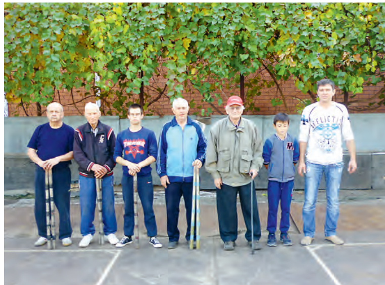
Турнир по городошному спорту в г. Астрахань.