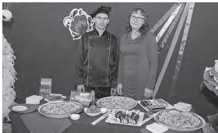
«Сицилия» – постоянный участник областных конкурсов и выставок.

Александра Тупыленко