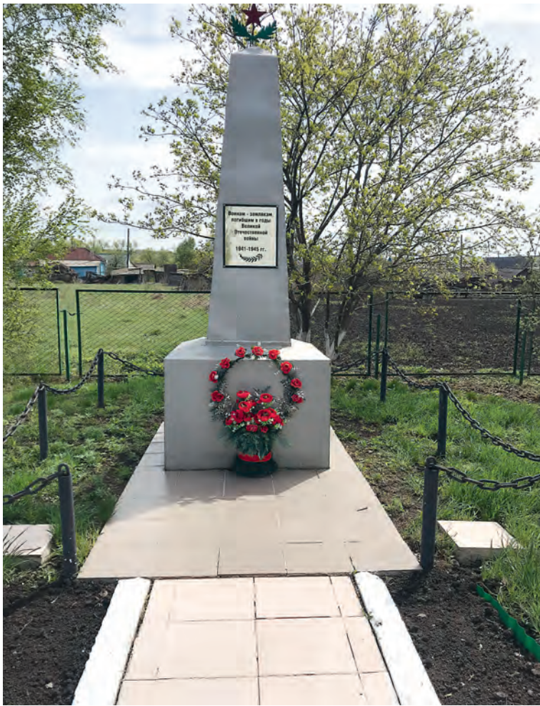
Обелиск памяти землякам-фёдоровцам.

На момент образования Татищевского и Вязовского районов в 1928 году Ивановка, Каменка и Фёдоровка не имели приставки «Большая». По крайней мере на картах они обозначались именно так. Сельсоветы носили названия, соответственно, Ивановский, Каменский и Фёдоровский. Если судить по картам, то «Большой» стала вначале Каменка. На карте 1941 года она уже обозначена именно как «Большая Ка-