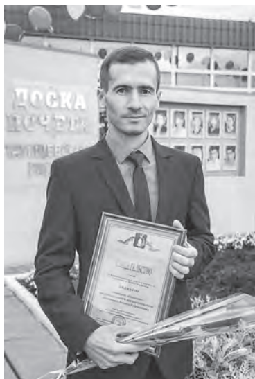
ИП «Ананикян» – на районной Доске почета.

Действительно, пиццерия стала успешной во многом благодаря тому, что её сотрудники сами получают удовлетворение от процесса. И каждый из них внес свой весомый вклад в развитие «Сицилии».