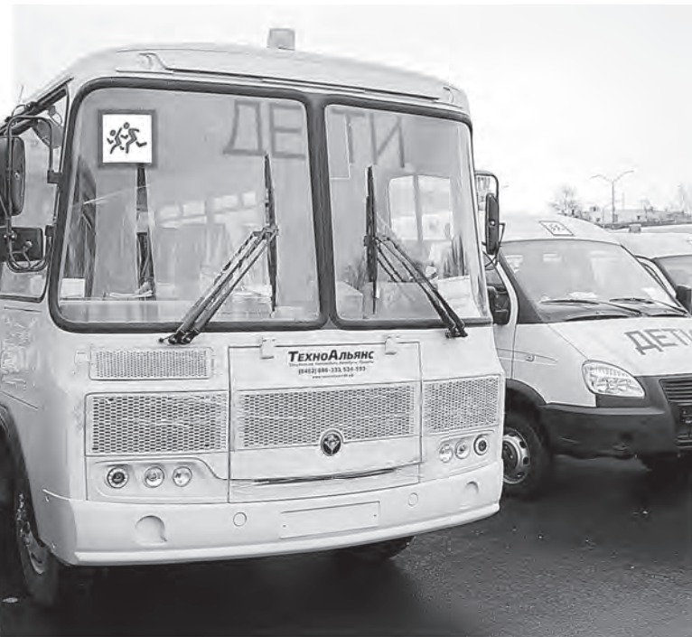
Школьный автопарк района обновлён.