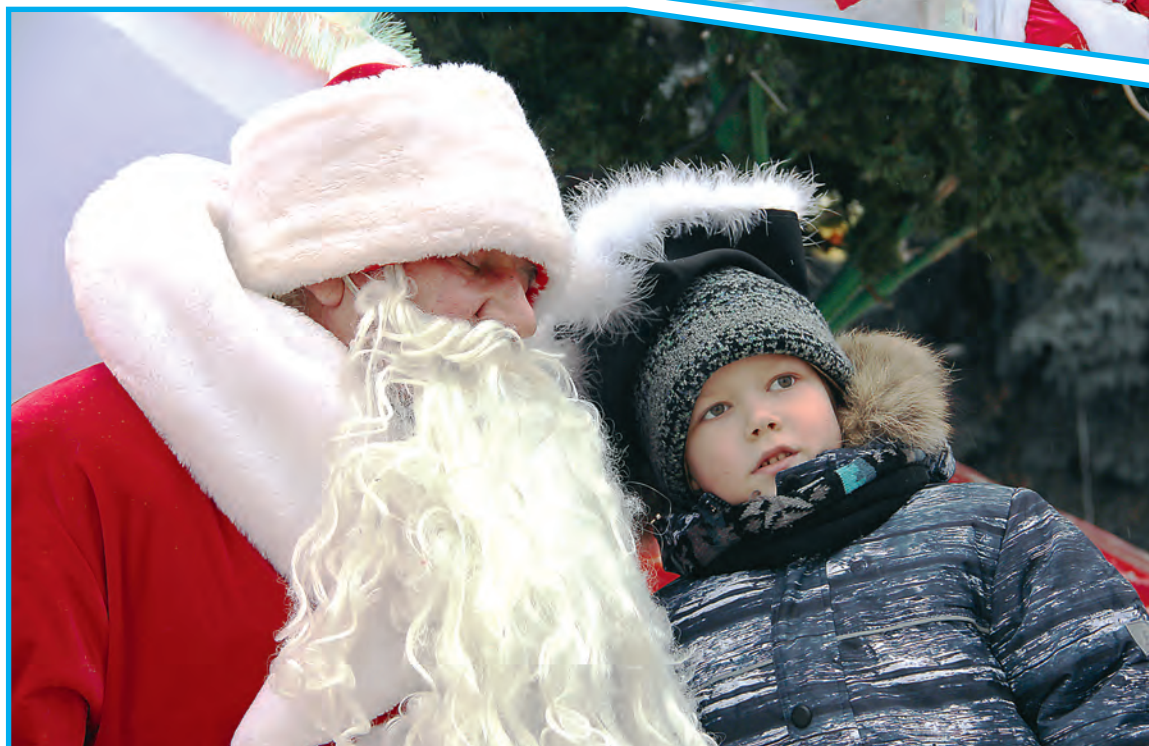
Встреча с главным зимним Волшебником – настоящее чудо для каждого ребёнка.

шестидесяти, а потом и вручать подарки. Сладости, куклы, машинки, роботы, конструкторы... всего не перечислишь!