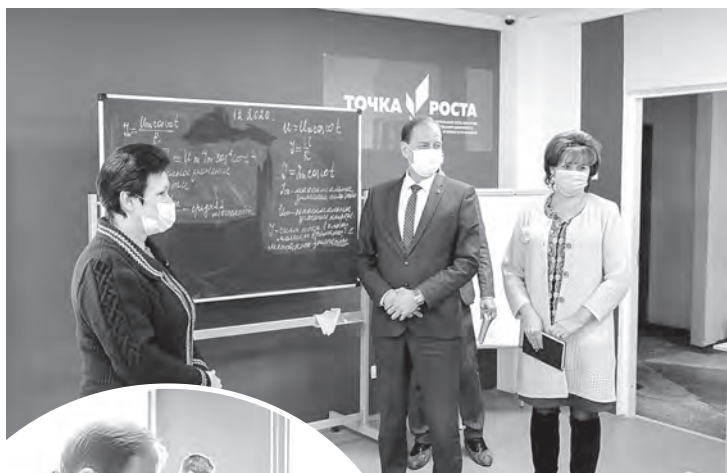
Во время посещения Вязовской школы и модельной библиотеки.

Тяжелая ситуация с водой в школе — еще одна актуальная проблема, требующая решения. Поэтому «спускать на самотёк» это нельзя. А значит вопрос о возведении отдельной скважины для обеспечения учреждения бесперебойным и качественным водоснабжением — один из основных на сегодняшний день.