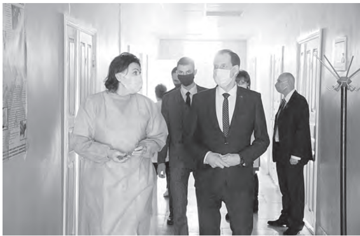
Обеспечение населения медицинскими услугами — на особом контроле.