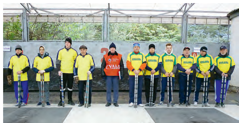
Команды Саратовской области и Краснодарского края.

Ребята активно развивают это необычное спортивное направле-