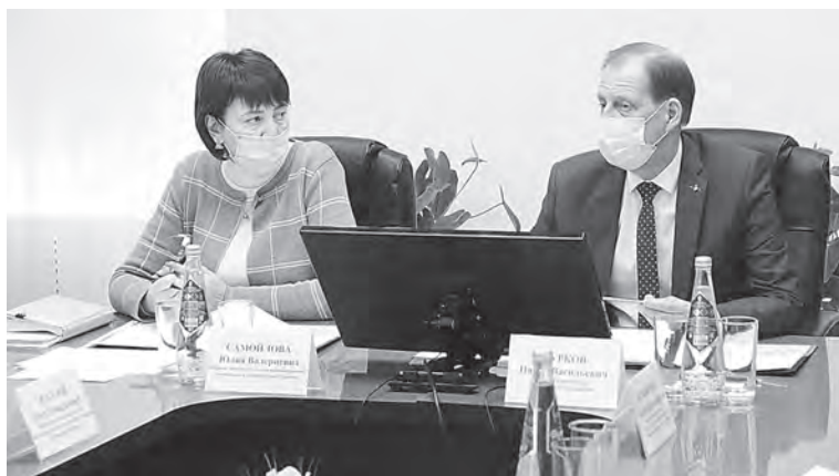
В ходе совещания.

— Мы имеем примеры, когда люди предложили хорошие проекты, но мы с трудом их реализовали. Не во всех муниципалитетах работа с населением, представителями бизнеса, подрядных организаций выстроена должным образом. Такого больше быть не должно, — подчеркнул глава. — Проекты на будущий год долж-