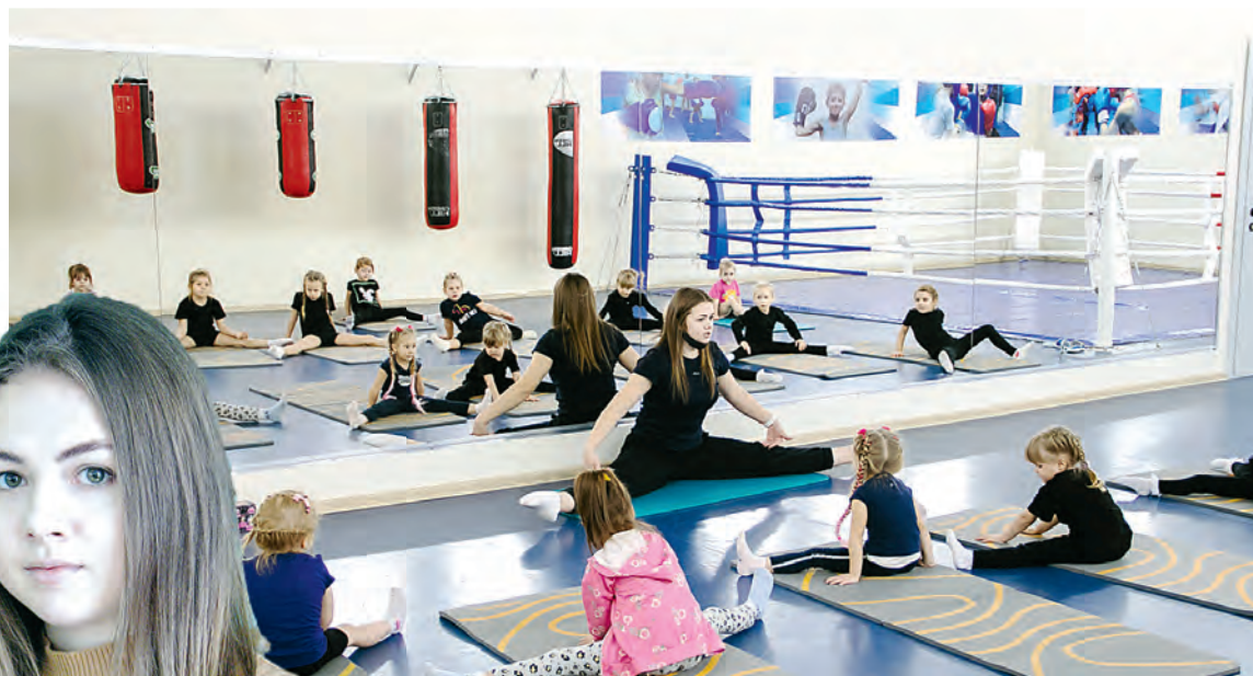
В художественной гимнастике всё начинается с просторного зала, где юные спортсменки работают над грацией и дисциплиной.

- В художественную гимнастику берут исключительно девочек. Гимнасткам присущи твердость характера, целеустремленность, стрессоустойчивость, выдержка, стойкость