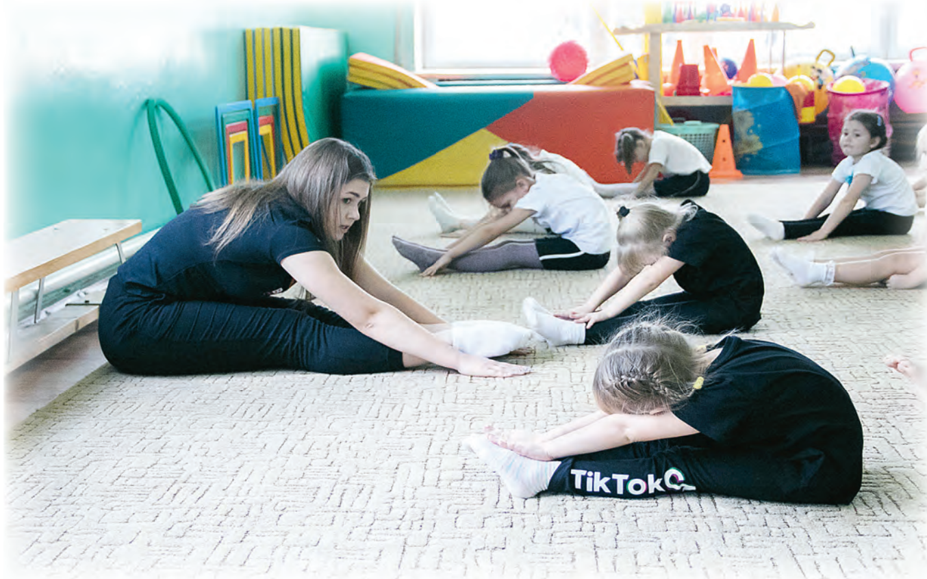
Гимнастика — разностороннее и гармоничное развитие.