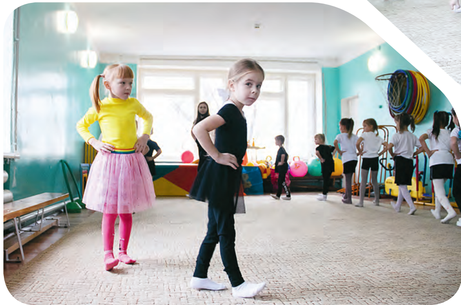
Первые шаги татищевских девочек в художественной гимнастике.

Беседовала Дарья Абрамова