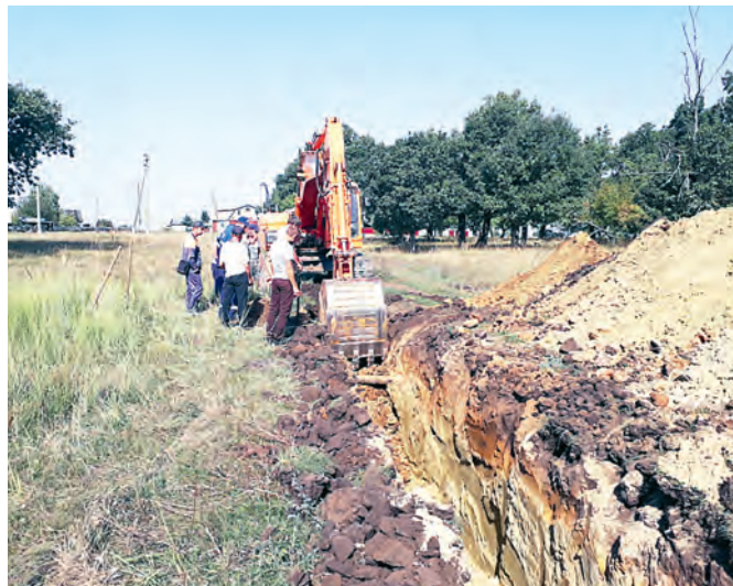
Самые масштабные проекты реализованы в Садовском МО.