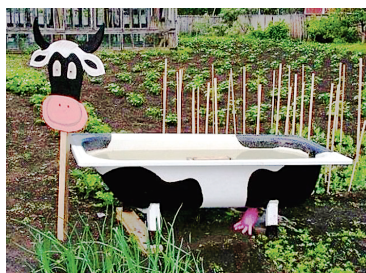
Старая ванна — незаменимая вещь на огороде.

Наверное, ни для кого не секрет, что дачники — самые изобретательные люди. Ведь чтобы привести в порядок свой участок, затратив минимум сил и денежных вложений, нужно очень постараться и включить смекалку и воображение. Самое главное на приусадебном участке — руки человека. Ведь все действия основаны и на ручном труде. Возможно ли как-то облегчить им