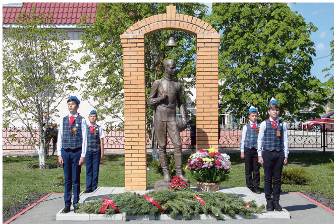
Памятник ушедшим на фронт выпускникам в сквере «Молодежный».

Читаем: «Как и большинство юношей нашей необъятной родины, они мечтали по окончании школы продолжать образование в институтах.