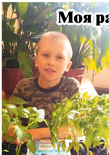
Вязовские дошколята с увлечением сажали цветы и рассаду.

«Что посеешь, то и пожнешь» — под этим девизом в детском саду с. Вязовка был организован дистанционный фотоконкурс «Моя рассада — глазам услада».