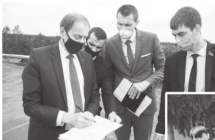
На фото: рабочие моменты инспекционной поездки.

Скоро эти планы претворятся в жизнь. Детсад изменится и снаружи, и изнутри. Ему предстоит «сменить» фасад, отремонтировать крыльцо, заменить старые стеклопакеты на современные пластиковые окна и старое ограждение — на новое. Здание, построенное более пятидесяти