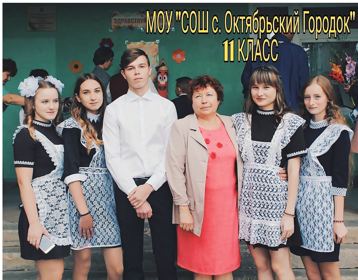
Последняя ступенька школьной жизни.

— Для меня самым важным является профессиональный и карьерный рост. Хотя я хочу выбрать хорошую, нужную профессию и буду стремиться