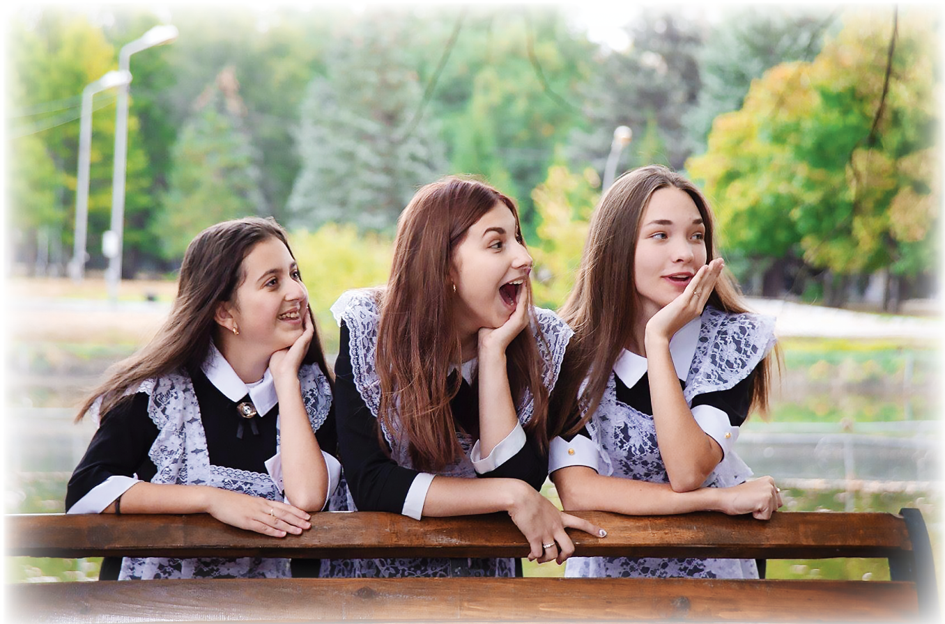
Успеваемость, спорт, волонтерство, самоуправление... Этим девушкам удается всё!