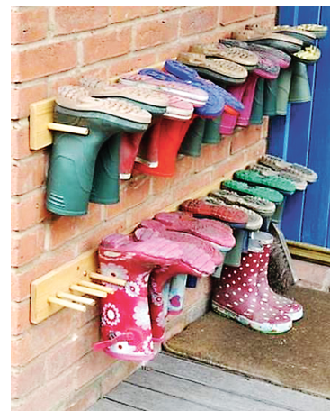
Органайзер для хранения обуви.

С помощью органайзера для хранения обуви можно неплохо сэкономить место. А сделать его совсем несложно, смастерив из