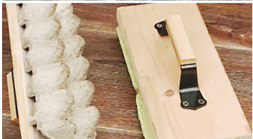
Маркеры для посева — сажаем быстро и ровно!

ляющие очень быстро сделать на грядке лунки под семена. Они представляют собой необычные грабли, которыми можно без особого труда за раз сделать не одну лунку, а целый ряд.