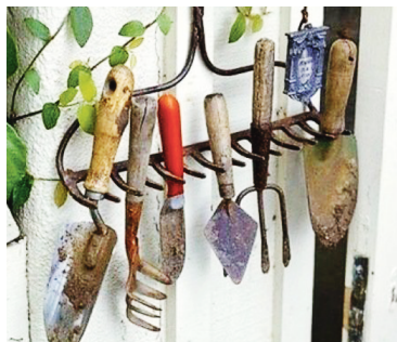
Всему своё место.

А дел на даче как известно всегда бесконечное количество... Только закончил одно — на подходе уже другое... Нужно распланировать, как будет выглядеть огород в этом году, подремонтировать прошлогодний парник (или ещё хуже — построить новый), высадить рассаду, посеять семена, вскопать землю... В общем дел невпроворот!