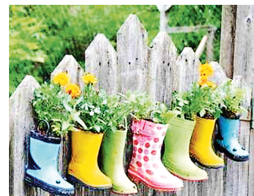
На даче не бывает лишних вещей, из всего можно сделать шедевр!

деревянных колышков. Их нужно забить на доску, которую необходимо прикрепить к стене. Такая вещь будет незаменима на дачном участке. А если резиновые сапоги пришли в негодность, то не спешите их выбрасывать. Ведь для выращивания растений подойдёт что угодно. И старые сапоги на даче — это просто находка! В них можно посадить цветы, и такие композиции будут радовать глаз на вашем участке.