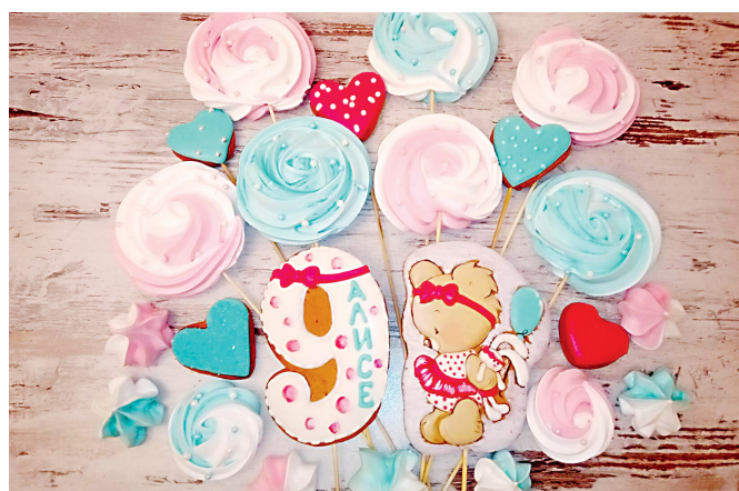
Сладкий подарок для маленьких мечтателей.