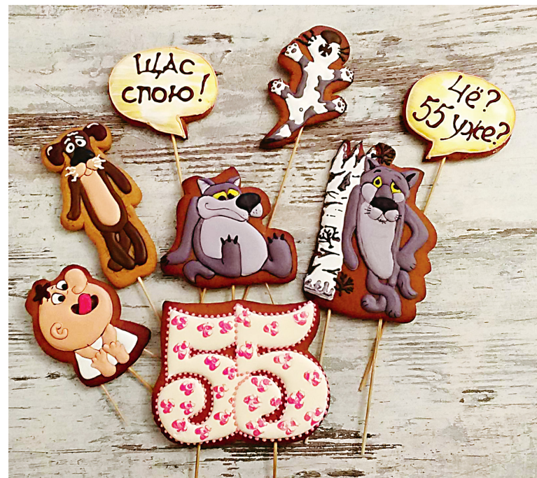
Такие пряники порадуют не только детей, но и взрослых!

На самом деле всё просто. В пряничном тесте много природных консервантов. Во-первых, это сахар и мёд. Они-то и являются натуральными консервантами. Во-вторых, это наши