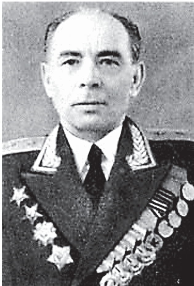
Кирилл Алексеевич Бабкин

Бабкин Кирилл Алексеевич (1900-1966), советский военачальник, генерал-лейтенант войск связи (20.04.1945). Родился 11 марта 1900 г. в с. Сокур в крестьянской семье.