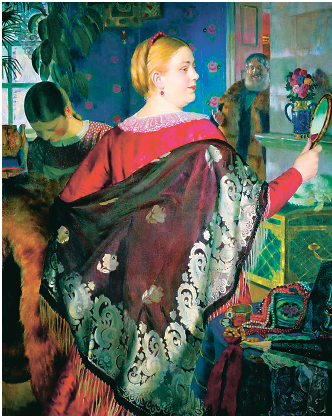
Борис Кустодиев. Купчиха с зеркалом. 1920 год. Холст, масло, 141x108 см. Государственный Русский музей, Санкт-Петербург.

Но современный читатель нередко оказывается в тупике, когда в классической литературе видит описание внешности героев. Мы ведь должны мысленно рисовать себе портрет литературного персонажа,