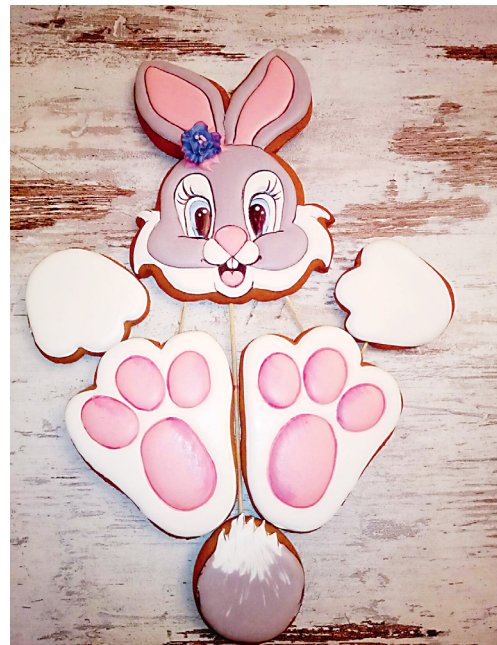
Лучший подарок — тот, что сделан своими руками.

9. Теперь можно приготовить себе чай или кофе и насладиться пряным согревающим вкусом имбирного пряника.