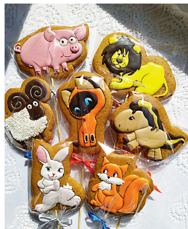
Удивительное лакомство на самый искушенный вкус.

- Это и само тесто и айсинг (так называется сахарная глазурь, которой покрывается пряник). Рецепт пряничного теста со мной поделилась моя тета - кондитер с большим стажем. Рецепт оказался очень удачным, так как пробовала другие рецепты - не понравились. Также очень важно правильно изделие выпечь. А ещё немаловажно, как в дальнейшем хранится пряник.